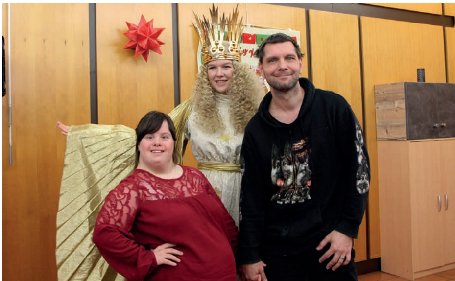
GLÜCKLICHE GESICHTER: Die Beschäftigten im Werk Süd bekamen die Gelegenheit, Fotos mit dem Christkind zu machen