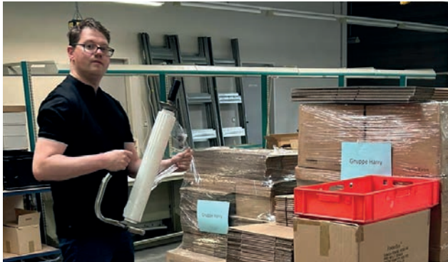
GUT VERPACKT: Beim Umzug muss alles genau sortiert und verpackt werden

Lange ist es her, dass die Druckerei in die Dorfäckerstraße zog. 2005 wurden dort die neuen Räume bezogen. Nach 18 Jahren dort startete das Team des Werk West Mitte 2023 die Umzugsaktion in die Werkstätten Süd und Nord.