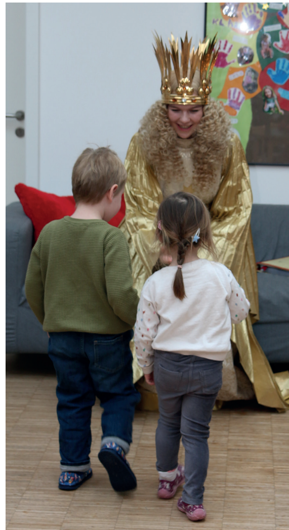
BEI DEN KÜKEN: Beim Besuch des Christkinds in der Kükenkoje wurden Kinderträume wahr