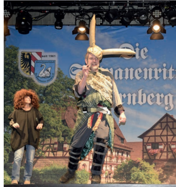
EIN SCHELM: Was führt Loki jetzt wieder im Schilde?

Die Feier-Laune bei der zweiten inklusiven Faschingsitzung war bis in den Abend hinein ungebrochen und die noris inklusion war sehr dankbar, bei dieser toll organisierten Veranstal-