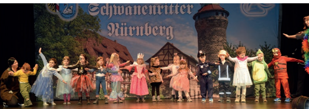
STARK WIE EIN TIGER: Die Tänze der Kita-Kinder entzückten das Publikum.