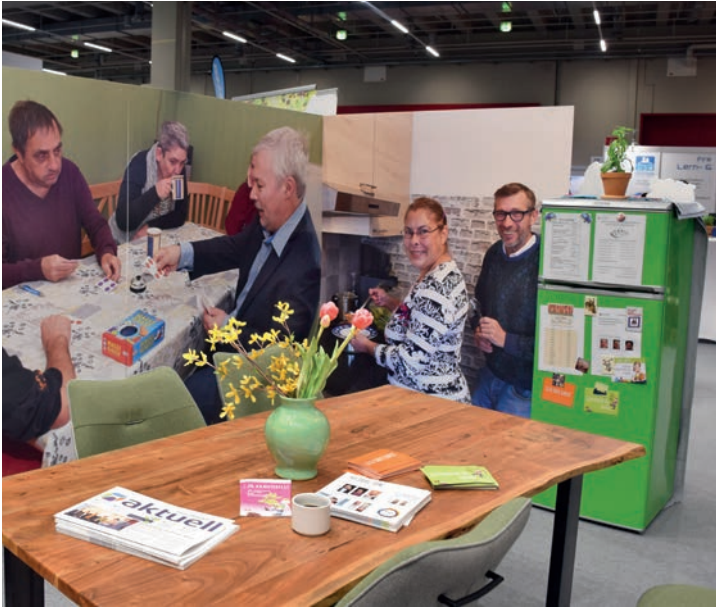
WIE ZU HAUSE: So kann es sich in einer der WG-Küchen anfühlen