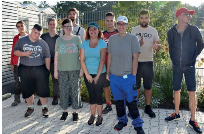
JETZT GEHT'S LOS: Die BBB-Teilnehmer freuen sich auf die neuen Herausforderungen

ausfinden, was sie später beruflich machen möchten, was sie gut können und was ihnen nicht so gut gefällt. Auch, indem sie verschiedene Praktika machen und in den unterschiedlichen Unternehmensbereichen der noris inklusion mitarbeiten. Wir wünschen ihnen eine spannende Zeit im BBB!