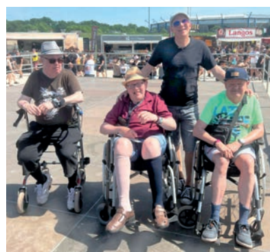
DIE TRIBÜNE: Von oben hatte man einen super Blick auf die Bühne