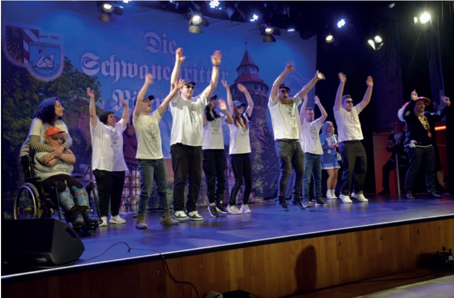
TANZBEIN SCHWINGEN: Die Tanzgruppe „noris people“ heizt der Menge ein

zeigten. Computerfreak Bodo trifft hier zum ersten Mal den Gott Loki, der ihn dazu anstiftet, die Götter zu einer Konferenz einzuladen. Was dann passiert, wurde nicht verraten, denn das machte das Publikum neugierig auf die anstehenden Vorstellungen im Februar.