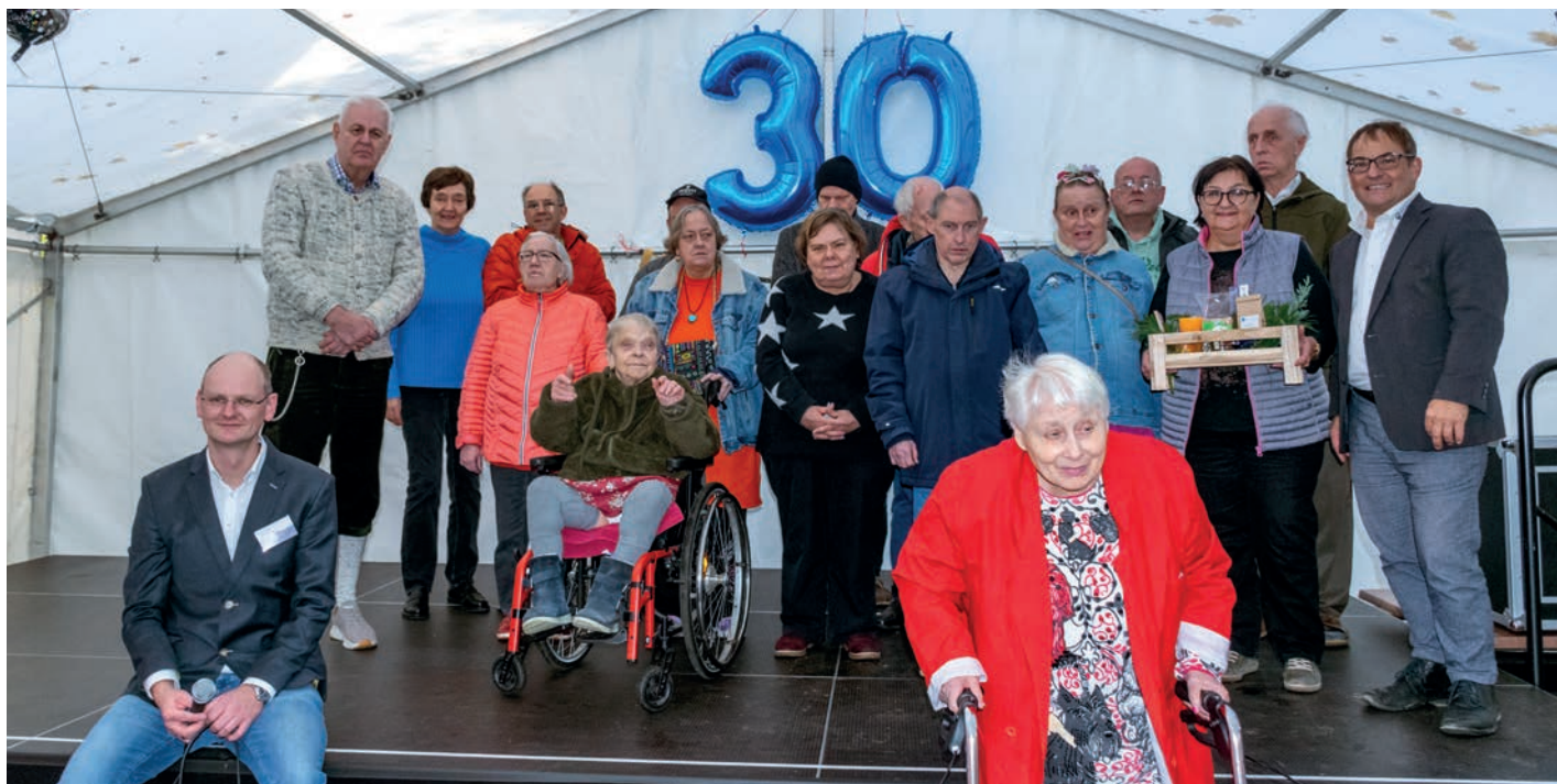
EINE EHRE: Die 13 Bewohnerinnen und Bewohner, die von Beginn an im Wohnheim Montessoristraße leben, wurden geehrt – doch es ist auch eine Ehre für das Wohnheim, dass sich die Menschen hier seit 30 Jahren wohlfühlen.