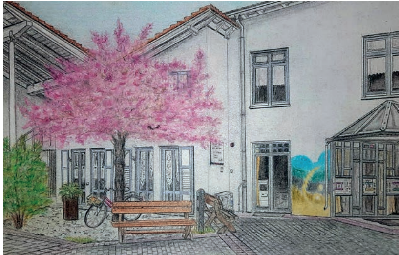
WOHLFÜHLATMOSPHERE: Die Zeichnung des Wohnheims von Josef Stachulla vermittelt dessen ruhige und offene Atmosphäre

Heute ist das Wohnheim in Langwasser fest verankert und steht im Austausch mit den Institutionen im Stadtteil. Dass bei der Feier zum