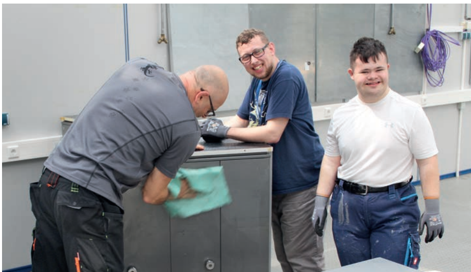
SAUBER: Wie bei jeden Umzug sollte alles gut geputzt sein