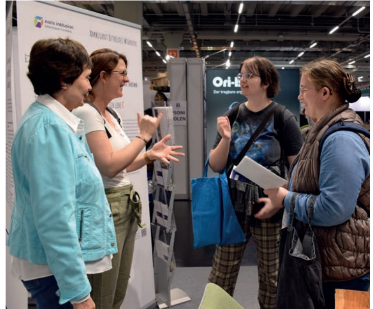
INTERESSIERT: Viele Messebesucher wollten mehr über noris inklusion erfahren

cherinnen und Besucher nahmen die Gelegenheit, persönlich ins Gespräch zu kommen und sich beraten zu lassen, gerne wahr.