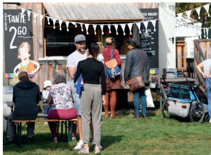
SOMMER: Im Park ist die Außenbewirtung sehr beliebt.