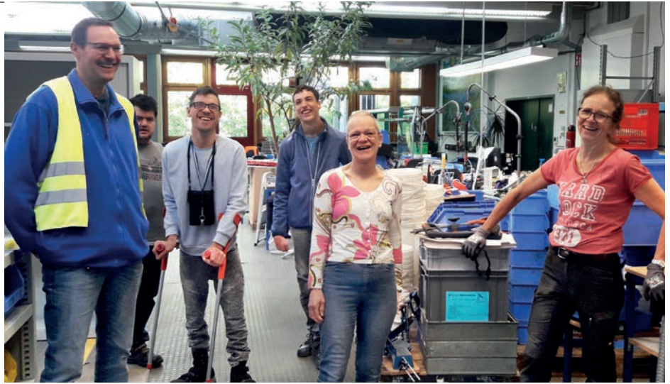
GLÜCKLICH: Nach dem beschwerlichen Umzug sind alle froh, nun angekommen zu sein

Vom Werk West ins Werk Süd – das hört sich einfach an, ist aber ganz schön aufwändig. Neben der Druckerei sind ja auch drei weitere Produktionsgruppen ins Werk Süd eingezogen. Dort sind – bis auf zwei Produktionsgruppen – alle von dem Umbau betroffen gewesen. Im Obergeschoss wurde bereits im Herbst 2022 mit den Bauarbeiten begonnen, um mehr Beschäftigte aufnehmen zu können. Das Erdgeschoss des Werk Süd wurde im ersten Halbjahr 2023 umgewandelt.