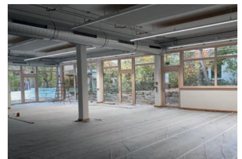
GENÜGENDE PLATZ: Im neuen Speisesaal können die Gruppen sich entspannt aufhalten