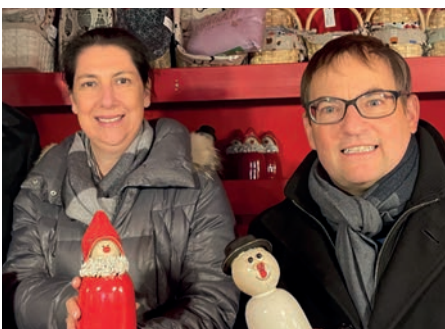
li: Katja Hessel (Parlamentarische Staatssekretärin im Bundesfinanzministerium)