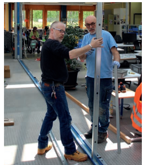
NEUE RÄUME: So schnell lassen sich aus einem Raum zwei machen