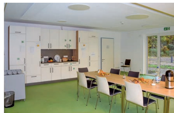
ZWISCHENSTAND: Der Rohbau lässt bereits erahnen, wie großzügig der Platz im Wohnheim aufgeteilt ist