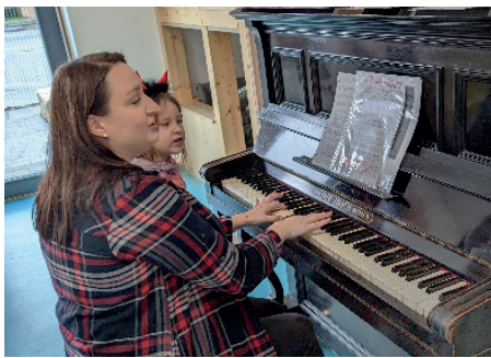
NEUE TÖNE: Dank einer Klavierspende erklingt neue Musik durch die Räume

Da unsere Kinder im Hasenhäusla aus vielen verschiedenen Nationen kommen und oft noch nicht deutsch sprechen können, ist gemeinsames Singen, Tanzen und Musizieren ein wichtiger Teil unserer Pädagogik. Jeden Mittwoch singen alle Kinder bekannte und neue Lieder und begleiten sie zum Teil