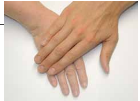
WUNSCH NACH NÄHE: Es muss nicht immer Sex sein. Oft reichen Berührungen aus.