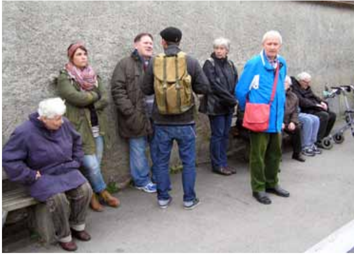
KURZE RAST: Anschließend ging es gleich weiter.