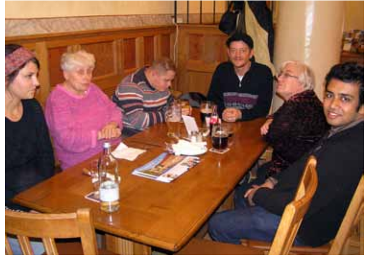
KLOSTERSCHÄNKE: Beim Mittagessen gab es Gelegenheit zum Plauschen.

des herbstlichen Wetters setzten wir uns unter Deck. Dort haben wir uns Kaffee und Kuchen schmecken lassen und genossen den herrlichen Ausblick. Leider vergehen schöne Tage immer sehr schnell. Nach der schönen Flussfahrt auf der Donau legte die Fähre in