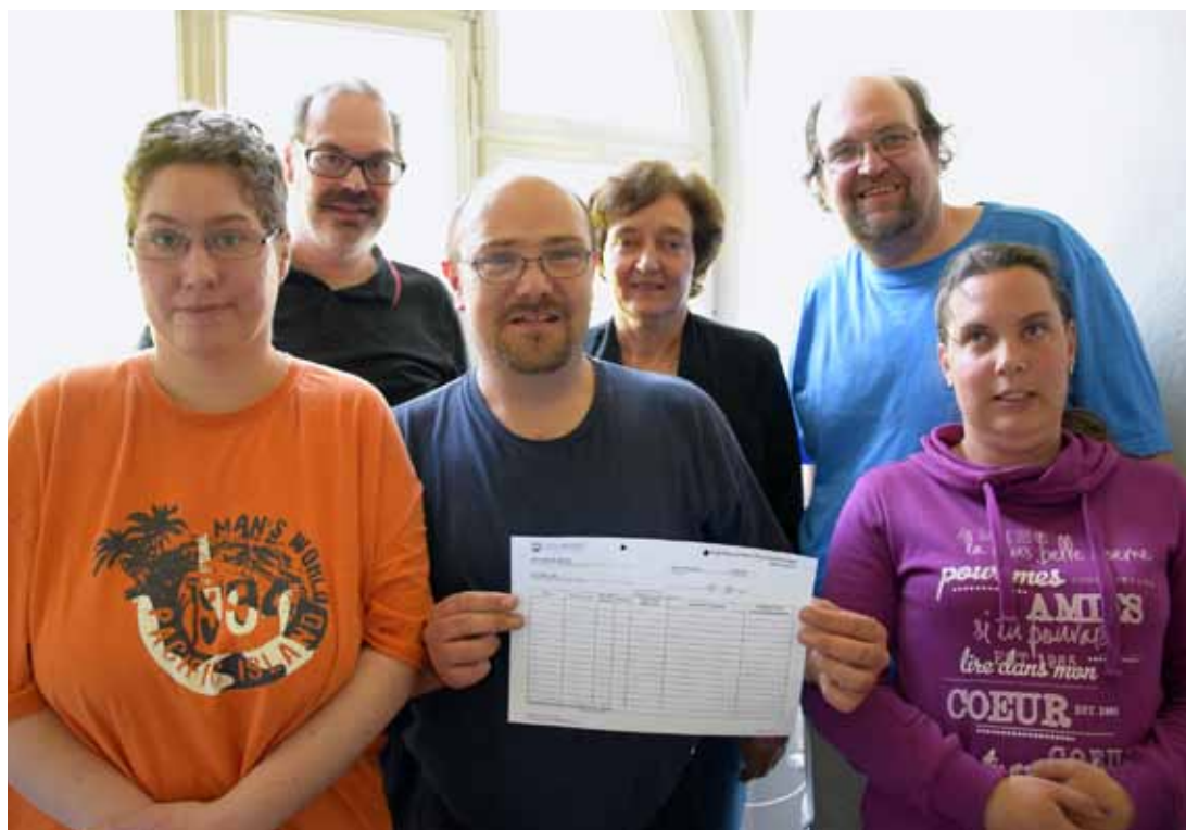
NEUES FORMULAR: Ab sofort reicht eine Unterschrift pro Monat aus.

In der Wohngruppe Rieterstraße ging jedes Mal wenn die Unterschriften geleistet werden mussten, ein großer Protest los. „Das wollen wir nicht