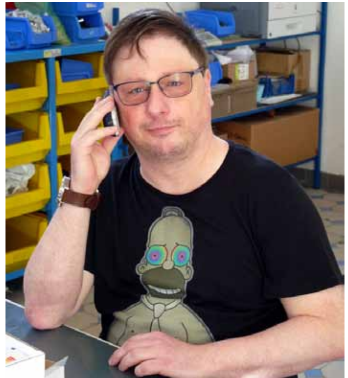
ER IST DER TELEFONMANN: Er geht in Buch ans Telefon ran.