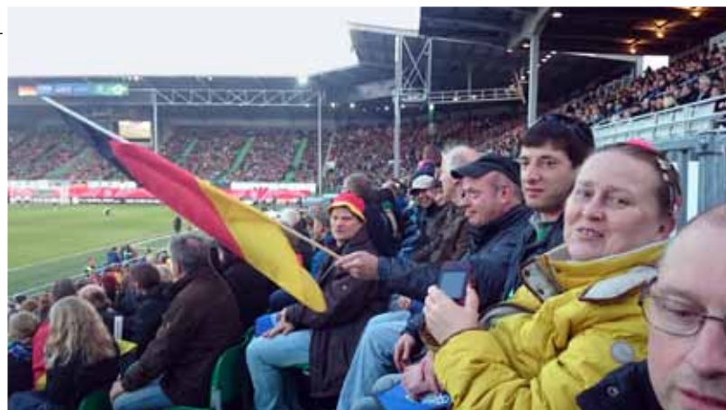
MOMENT DER RUHE...: ...bis die nächste La Ola-Welle anrollt.

4:0 gegen die Brasilianerinnen gewannen. Da waren die Freude und der Jubel riesig. Doch das Spiel war nicht das Einzige, was die Aufmerksamkeit der Bewohner fesselte. Diese achteten stets darauf, keine der „La Ola“-Wellen zu verpassen. Neunzig Minuten klatschten und jubelten wir, fieberten mit, hielten die Luft an und schwenkten Fahnen. Alles, was eben zu so einem Spiel dazugehört. Letztendlich hat allen das Spiel gefallen,