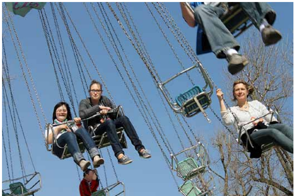
NOSTALGIE: Das Kettenkarussell macht immer noch viel Freude.