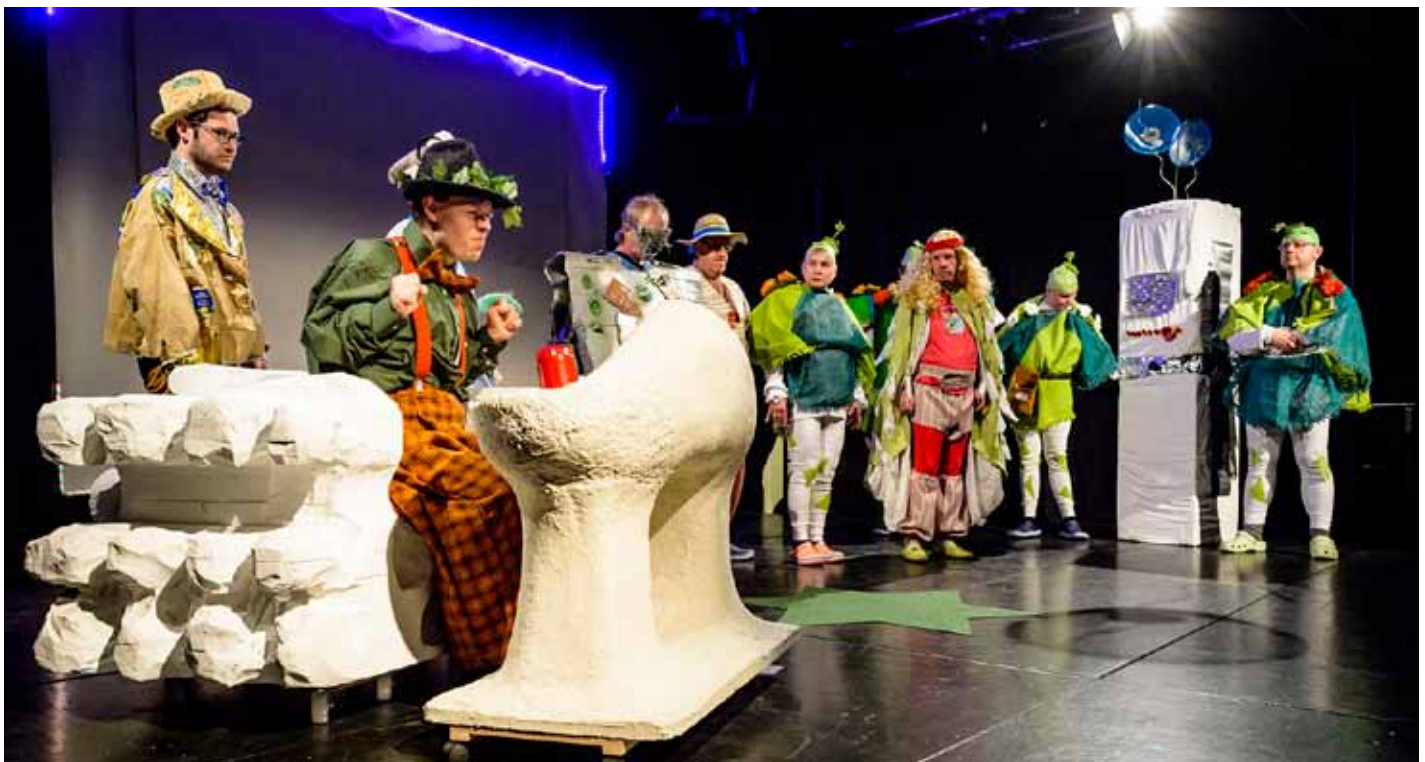
ABGEDREHT: Die Kostüme waren ein echter Blickfang.