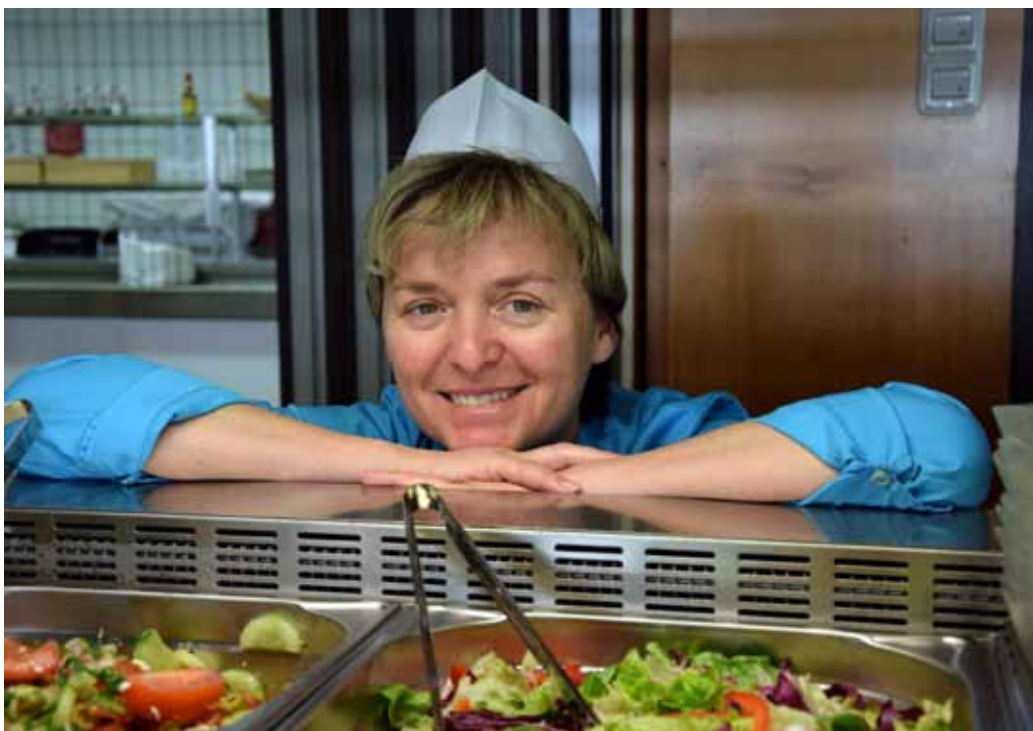
GANZ NEU: Die Salattheke kommt bei den Beschäftigten sehr gut an.