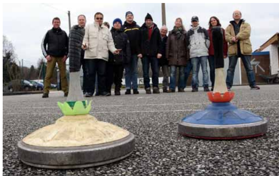
SPORTLICHES ABW: Der Start ins Stockschießen gelang dank des TSV Fischbach spielend.