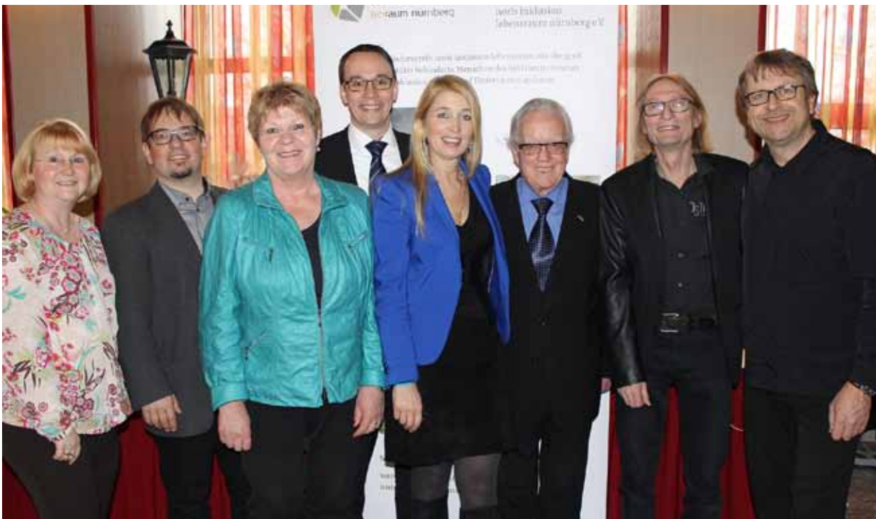
ERFOLGREICHE ZUSAMMENARBEIT: Der Förderverein freute sich am Ende der Matinée über 2000,- Euro.