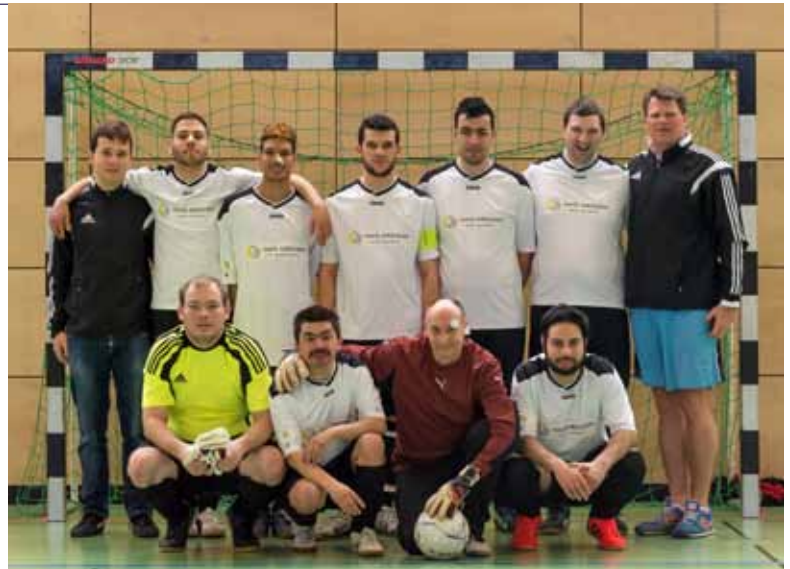
GRANDIOSER START: Der Turniersieg gibt viel Selbstvertrauen für die kommende Saison.

nach dem Prinzip „Jeder gegen Jeden“ stattfinden zu lassen. Noris inklusion hatte sich damit dem letztjährigen Hallencupsieger BVS Fürth, den starken Verfolgern Irchenrieth und Augsburg sowie dem unbekanntem Gegner aus Ansbach zu stellen. Souverän konnte Ansbach im ersten Spiel bezwungen werden. Das nächste Spiel gegen den BVS Fürth gestaltete sich jedoch als sehr schwierig, da der BVS Fürth geschickt verteidigte und auf Konter lauerte. Die Fürther gingen dann auch in Führung und erst Sekunden vor Schluss konnten die noris Kicker den Ausgleich erzielen. Ähnlich schwer taten sie sich beim darauffolgenden Spiel gegen die Augsburger Mannschaft, die sich hinten reinstellte und mit einem hervorragendem Torhüter den Endstand von 1:0 verhindern wollten. Im letzten und entscheidenden Spiel gegen Irchenrieth bissen die noris Spieler die Zähne zusammen, um mit einem Sieg den Turniersieg nach Punkten nach Hause zu tragen. Viel Willen und Kampfeskraft war nötig, um einen hart umkämpften 2:1 Erfolg