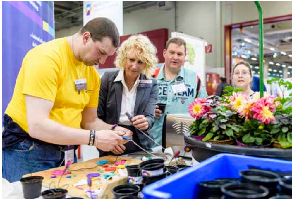
BLUMEN BLÜHEN: Die Fimoblumen durften die Besucher anschließend mit nach Hause nehmen.

Auch am Stand von noris inklusion gab es für Jung und Alt jede Menge zu erleben. Der Fokus lag in diesem Jahr eindeutig auf den Dienstleistungsangeboten der Natur-Erlebnis-Gärtnerei am Marienbergpark. Denn seit Herbst letzten Jahres ist noris inklusion nun ganz offiziell ein „Saftladen“. Etwas das wohl nur die wenigsten Werkstätten von sich behaupten können und wollen. Noris inklusion ist sichtlich stolz darauf, verbirgt sich dahinter doch ein Dienstleistungsangebot rund um das Thema Obst. Obstbaumbesitzer und Saftfreunde können ihr geerntetes Obst liefern, damit im