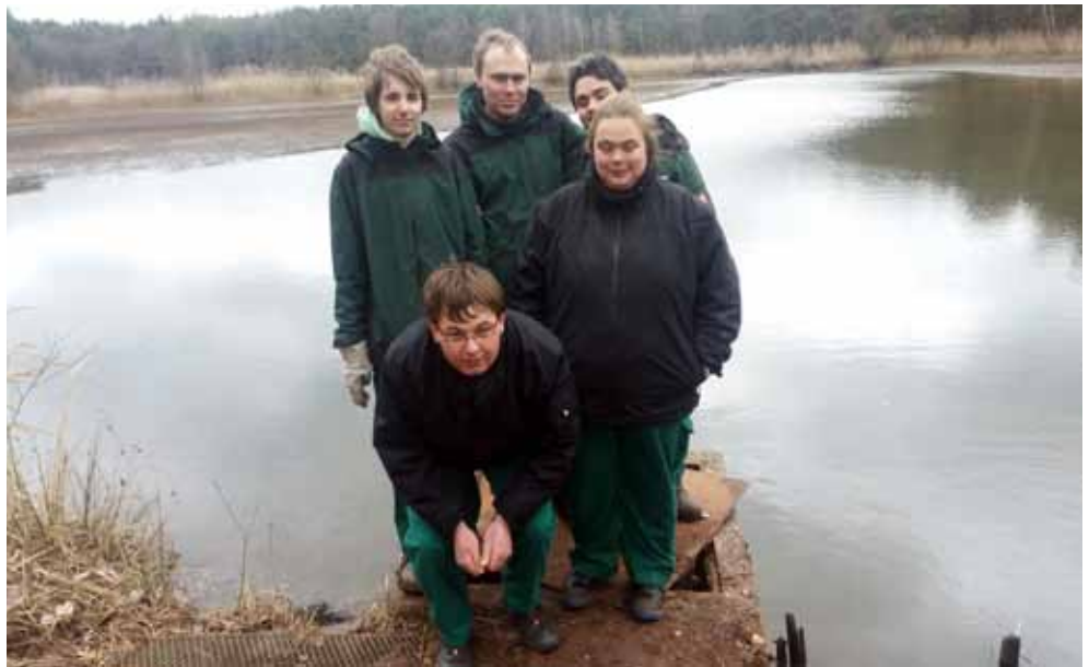
ENGAGIERT: Neben Renaturierungsmaßnahmen steht natürlich auch das Angeln im Vordergrund.

dass die Weidenzweige Wurzeln schlagen und so den Untergrund soweit stabilisieren, dass der Damm nicht weiter abgetragen werden kann. Natürlich müssen die Angler den Damm immer wieder kontrollieren. Nach so viel Arbeit wünschen sich die Angler viele dicke Fische und viel Spaß am tollen Gewässer. Der westlich der Stadt Erlangen gelegenen Weiher wurden ursprünglich als Karpfenteich genutzt. Die Größe des Weihers beträgt 28.000 m 2 und er hat eine maximale Tiefe von einem Meter. Im Rotweiher sind Aal, Barsch, Hecht, Karpfen, Schleie, Rotaugen und Karauschen heimisch.