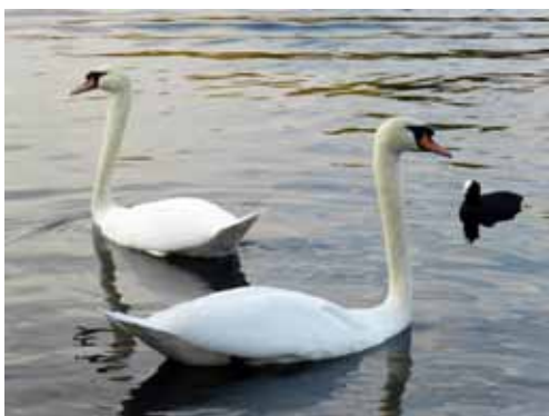
ENTSPANNEND: Zeit in der Natur zu verbringen wirkt beruhigend.