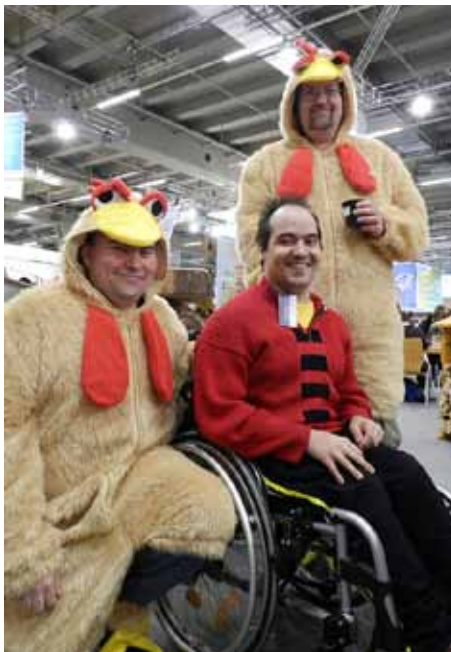
FOTOSHOOTING: Ein Schnappschuss mit den Hühnern war heiß begehrt.

übrigens ausdrücklich erlaubt. Wer weitere Abenteuer mit den berühmten Hühnern erleben wollte, hatte direkt am Stand die Gelegenheit zu einer Malaktion, die anlässlich der fünfjährigen Zusammenarbeit mit der Firma Staedtler statt fand.