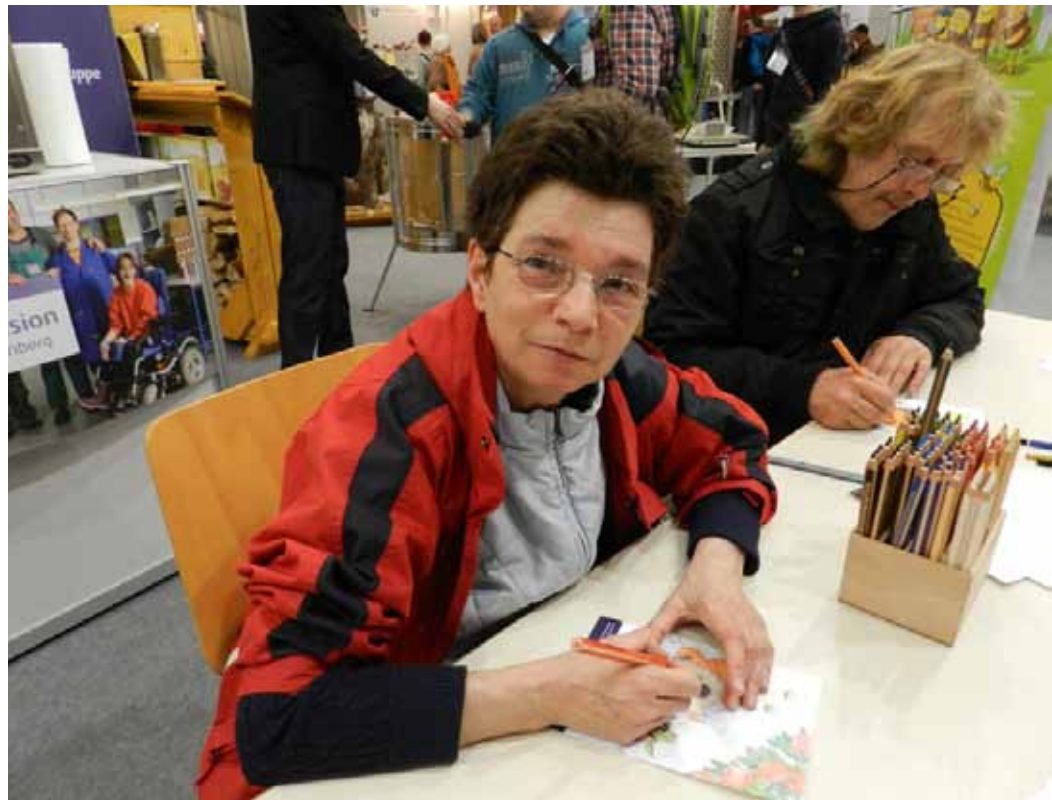
MITMACHEN: Die Malaktion fand großen Anklang bei jung und Alt.

Noris inklusion ist über die Stadtgrenzen hinaus mittlerweile für seine berühmten Rent-A-Huhn-Hühner bekannt. Doch keiner hatte damit gerechnet, das flauschige Federvieh direkt am Stand anzutreffen. Drei Beschäftigte hatten sich den Spaß gemacht und sich für die Besucher in überdimensionale Hühnerkostüme gesteckt. So entstanden jede Menge verrückter Fotos und Selfies, die mit dem Handy mitunter direkt verschickt wurden. Das Füttern der Hühner mit Keksen war