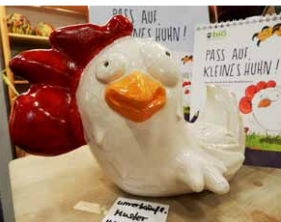
EINZELSTÜCK: Das Rent-A-Huhn aus Keramik ist leider unverkäuflich.

Direkt um die Ecke präsentierte sich erstmals geschlossen der Werkraum von noris inklusion. Die verschiedenen Fertigungsprozesse wie Montagearbeiten, Metallverarbeitung