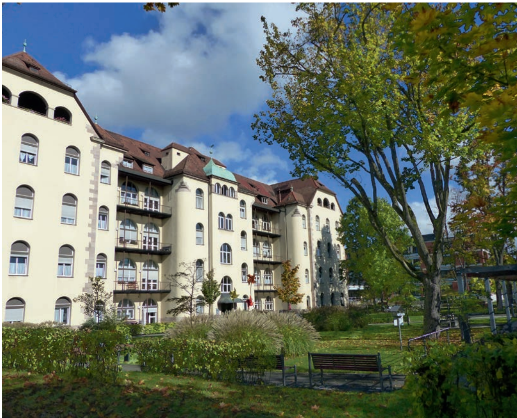
AM WÖHRDER SEE: Das Elisabeth-Bach-Haus bietet ab Dezember dreizehn Menschen mit Behinderung ein neues Zuhause.

ich vielleicht auch mal selber kochen oder am Wöhrder See selbstgemalte Bilder verkaufen, wie früher in der Stadt“. Für die Bewohner ist das Naherholungsgebiet am Wöhrder See eine grüne Oase direkt vor der Haustür. Vielleicht sind Sie im Sommer auf dem Weg zum Café Seeblick und treffen Robert Knüpfer mit seinen Bildern. Dann wissen Sie, dass seine Vorstellungen Wirklichkeit geworden sind.