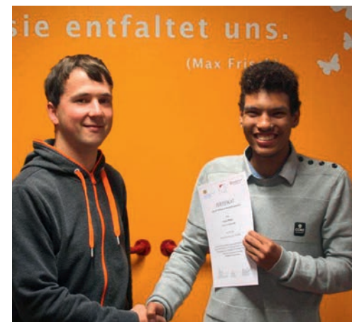
ANERKENNEND: Jeder Teilnehmer erhält ein offizielles Zertifikat.

zierung innerhalb der Werkstätten aufzuzeigen. Das Zertifikat zeigt nun genau und detailliert, in welchen Bereichen und Berufsfeldern sich der jeweilige Teilnehmer qualifiziert hat. Auch bei noris inklusion wurden die ersten landesweit einheitlichen Abschlusszertifikate bereits den ersten Teilnehmern überreicht und sind bei den Empfängern sehr gut angekommen. Die Teilnehmer freuten sich über die offizielle Anerkennung ihrer Leistung!