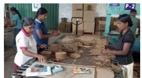
HANDARBEIT: Hier werden die Deckel für die Coco Pots gefertigt.