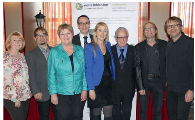
ERFOLGREICHE ZUSAMMENARBEIT: Der Förderverein freute sich am Ende der Matinee über 2000,- Euro.