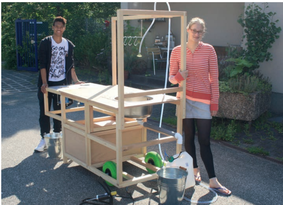
BRÜCKENBAU: Die mobile Küche aus dem BBB trägt zur Inklusion bei.

Der Berufsbildungsbereich griff im Rahmen einer Bildungseinheit das in den letzten beiden Jahren wichtige Thema „Flüchtlinge“ auf.