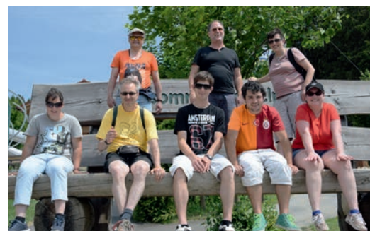
ACTION ZWISCHENDURCH: Neben der Entspannung stand auch eine Sommerrodelbahn in der Nähe der Riesenbank auf dem Programm.