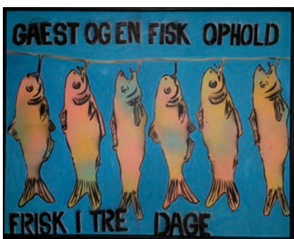
DÄNISCHES SPRICHWORT: „Gäste und Fisch bleiben kaum drei Tage frisch“

Linke hatten deshalb eine rettende Idee: „Wir bleiben einfach hier!“