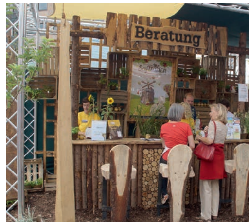
ALLES BIO: Am Stand konnten Kunden sich mit erstklassigen Kräutern eindecken.

auf dem Balkon gegärtnert werden kann. Wer wollte konnte sich direkt vor Ort mit Pflanzen und Kräutern für seinen Balkon oder Garten eindecken, denn noris inklusion hatte jede Menge feinste Kräuter in Bio-Qualität mitgebracht. Passend dazu gab es frischen Bio-Honig zu kaufen, der aus der eigenen Imkerei am Marienbergpark stammt. Gleichzeitig wurden Imker über das Dienstleistungsangebot der „flotten Biene“ informiert. Wer keine Lust auf Honig hatte, konnte sich an frischem Saft erfreuen, natürlich ebenfalls in Bio-Qualität. Die aufgestellte Saftpresse wies auf das Angebot für