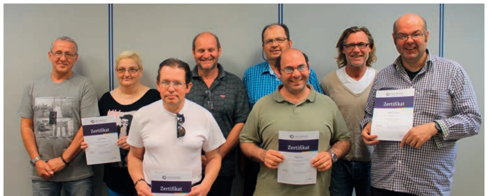
AUSZEICHNUNG: Nach der erfolgreichen Prüfung erhielten die Teilnehmer ihre wohlverdiente Urkunde.

Auszeichnung eine Urkunde. Die frisch ernannten Sicherheitsbeauftragten begleiten auch regelmäßig das Team für Arbeitssicherheit bei den Begehungen der Betriebsteile. Obwohl sie erst kurz im Amt sind, konnten sie schon manchen wertvollen Hinweis geben.