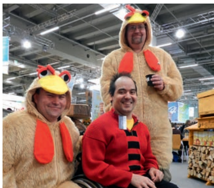
FOTOSHOOTING: Ein Schnappschuss mit den Hühnern war heiß begehrt.

Am 14. April war es wieder so weit: Die Werkstätten:Messe 2016 öffnete für über 20.000 begeisterte Besucher ihre Pforten. Bereits zum elften Mal präsentierten sich in diesem Jahr die bundesweiten Werkstätten in Nürnberg und luden zum gemütlichen