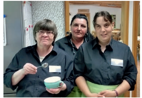
WEITER GEHT'S: Auch 2017 wollen alle wieder mitarbeiten.

satz stieg im Vergleich zum letzten Jahr deutlich an und besonders bei schönem Wetter kam das Team des Waldcafés ganz schön ins Schwitzen. An den Samstagen freute sich die Mannschaft über zahlreiche Reservierungen von Geburtstagskindern, die ihre Gäste ins Waldcafé einluden. Aber auch Wohnheime und Kindergärten besuchten das einzigartige Café. Der Mitarbeiter-Stamm ist insgesamt stabil geblieben. Es kamen Mitarbeiter hinzu, andere haben gewechselt. Alle hatten viel Spaß und möchten auch nächste Saison