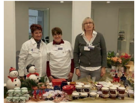
BESONDERS BELIEBT: Leckere Marmelade und feine Plätzchen

Holzsterne sowie Christrosen und Weihnachtssterne aus dem Gartenbau verkauft. Besonders das Weihnachtsgebäck und die Marmelade fanden großen Anklang.