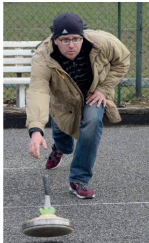
PRÄZISIONSSPORT: Viel Gefühl und Augenmaß ist beim Stockschießen gefordert.

Der TSV Fischbach hatte Mitte März Betreute aus dem Ambulant Betreuten Wohnen (ABW) zum Stockschie-