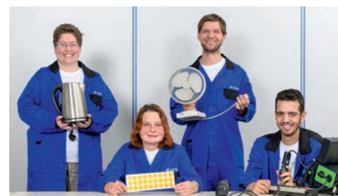
OPTIMAL GESCHULT: Die Elektroprüfungskräfte von noris inklusion.

der gesetzlichen Vorschrift DGUV-3 selbst durchführen konnten, mussten viele Bedingungen erfüllt sein. Beispielsweise musste ein geeignetes Prüfgerät gefunden und beschafft werden. Wie bei jeder neuen Arbeit wurden unsere Beschäftigten im richtigen Umgang mit dem Prüfgerät geschult. Hier war einiges an Übung notwendig, damit im Laufe der Zeit die ersten Prüfungen von elektrischen Geräten wie Verlängerungskabel, Wasserkocher oder PCs im Werk Süd durchgeführt werden konnten. Nach erfolgreicher Prüfung wurden dann die Geräte mit einem gelben Prüfsiegel gekennzeichnet. Mittlerweile hat die Gruppe die Prüfungen im Werk