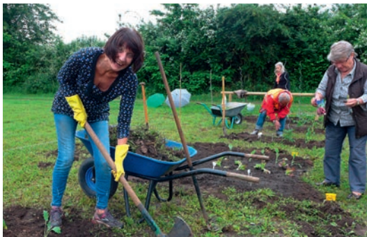
VOLL DABEI: Die Hörer der Straßenkreuzer-Uni packten kräftig an.

Seit kurzem bietet die Natur-Erlebnis-Gärtnerei von noris inklusion Mitmachgärten für Schulklassen und Kindergärten. Den Startschuss für das Angebot gab die Straßenkreuzer Uni in einem ersten Testlauf. Einfach mal