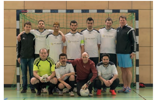
GRANDIOSER START: Der Turniersieg gab viel Selbstvertrauen für die kommende Saison.

Damit stand einer erfolgreichen Saison 2016 nichts mehr im Wege!