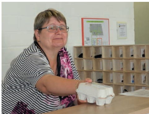
EI EI EI: Am Empfang können Kunden auch ihre Rent-A-Huhn-Eier abholen

Seit Mai gibt es für Besucher, Gäste, Lieferanten und Beschäftigten eine neue Anlaufstelle – den Empfangsbereich. Wer das Werk West betritt wird freundlich von den Beschäftigten begrüßt. Dies hat vor allem