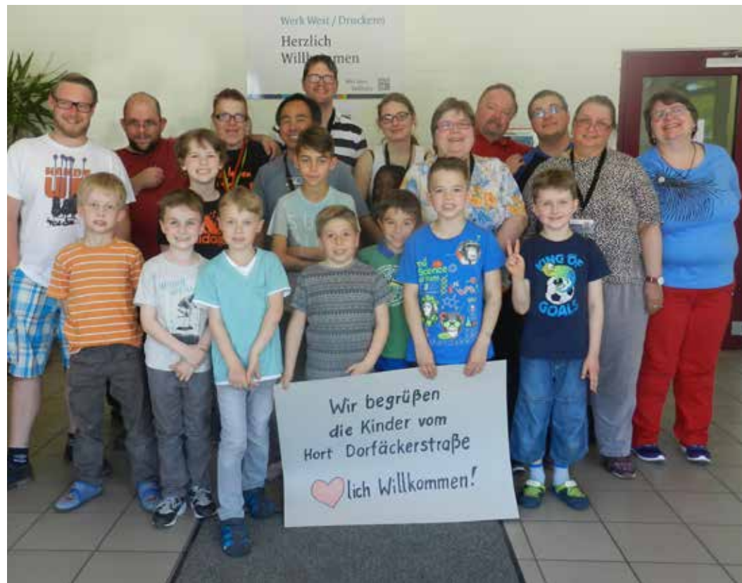
SPANNEND: Die Kinder aus dem Hort informierten sich über Menschen und Firmen in der Umgebung.