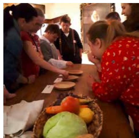
KNIFFELIG: Getreidesorten zu bestimmen ist gar nicht so einfach