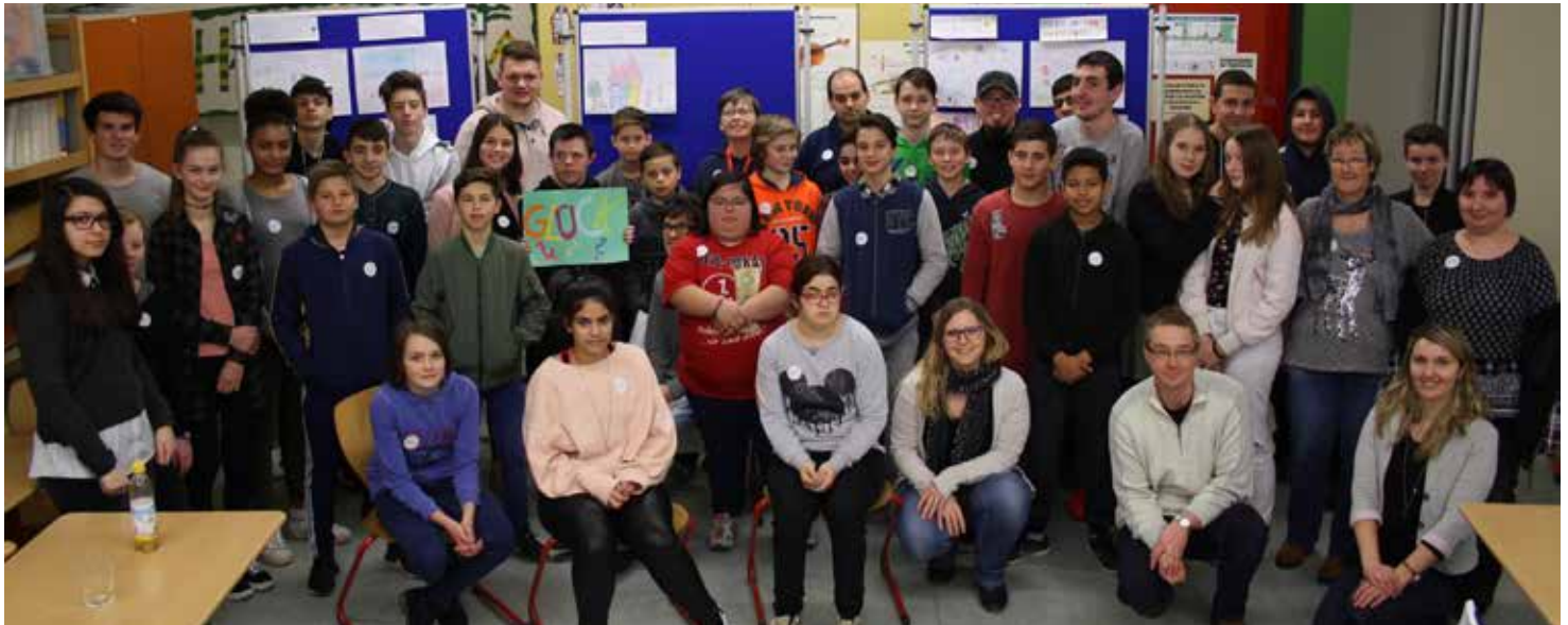
AUF DEM WEG ZUM GLÜCKLICHSEIN: Die Schüler der Bertolt-Brecht-Schule mit den Beschäftigten von noris inklusion.

Treffen, haben wir viel darauf geachtet, dass alle ihrer Kreativität freien Lauf lassen können. Wir haben Jutebeutel gestaltet, Tontöpfe bemalt und Kresse eingepflanzt, zusammen leckeres Essen gekocht und als Abschluss etwas mit Fimo-Knete gebastelt. Zur Entspannung