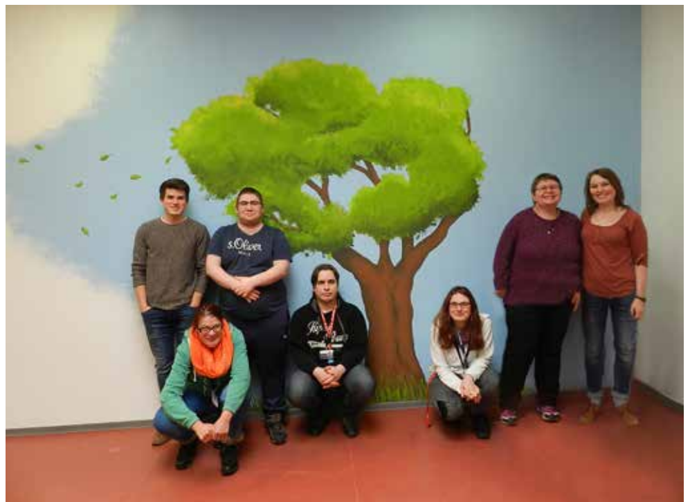
KREATIV: Gemeinsam entstand ein eindrucksvolles Wandbild, das zur Stimmung beiträgt.