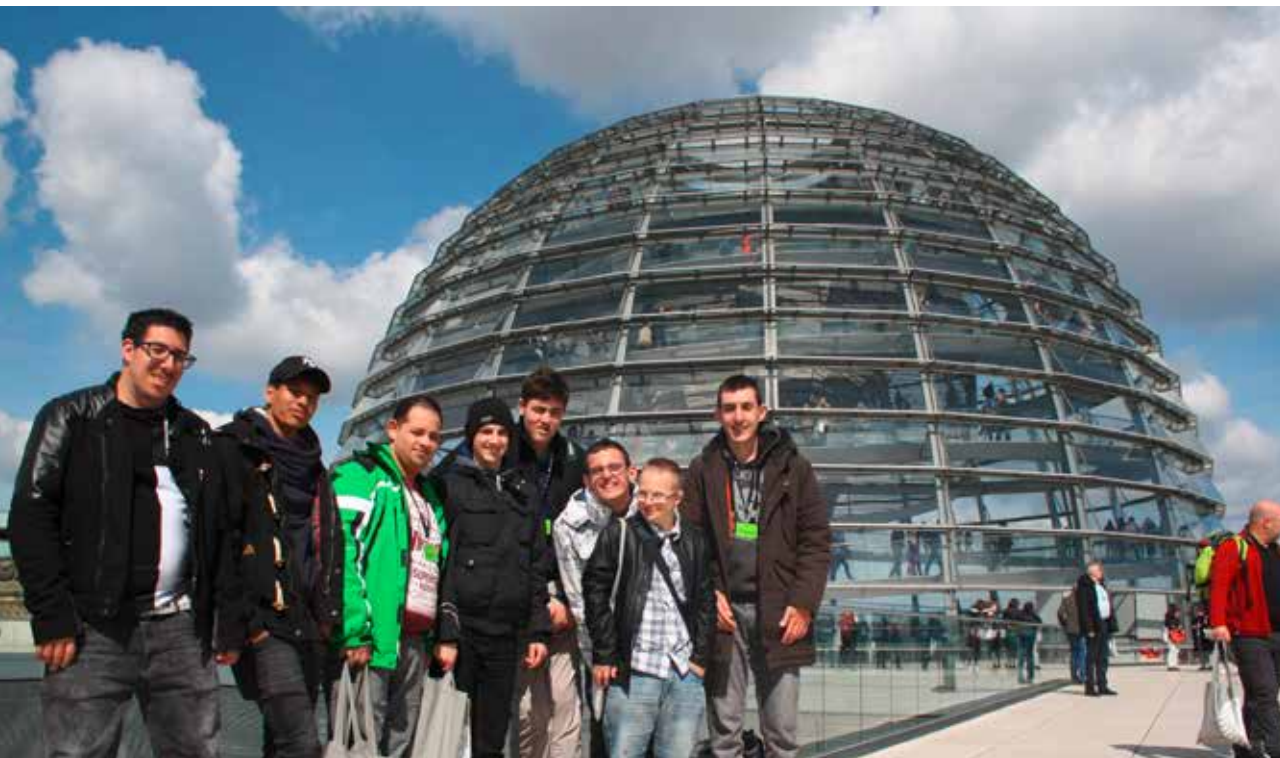
STRAFFES PROGRAMM: Die Teilnehmern sammelten in kurzer Zeit viele Eindrücke.

Am nächsten Morgen ging es früh zum Reichstagsgebäude und auf die Besuchertribüne des Plenarsaales. Von dort hörte die Gruppe einem Vortrag über die Aufgaben des Parlamentes zu. Jetzt wissen wir wie Gesetzesentwürfe entstehen, eingereicht, diskutiert und dann möglicherweise verabschiedet werden. In der anschließenden Diskussion mit