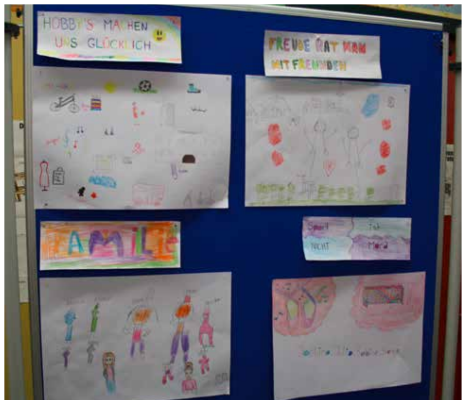
INDIVIDUELL: Für jeden ist Glück etwas anderes, wie die Plakate zeigen.

Alle fanden das Kunst-Vorhaben klasse und hatten viel Freude daran