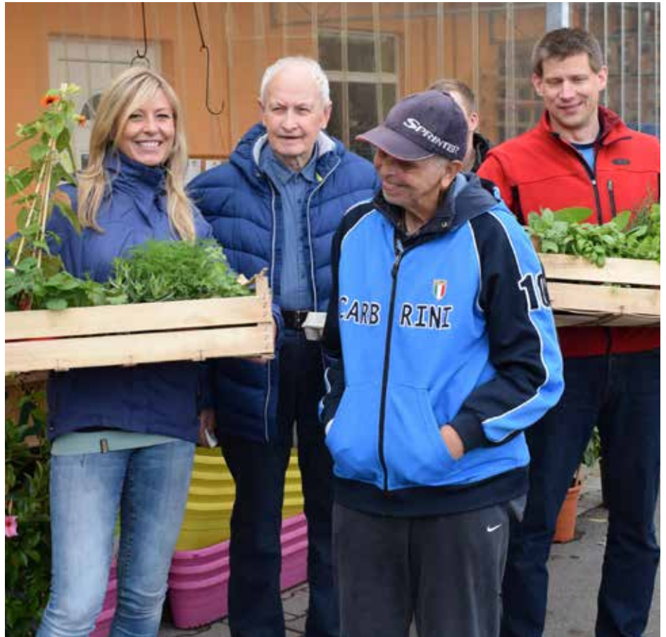
SHOPPING: Im Gartenbau wurden Pflanzen für das Hochbeet gekauft.

Zuhause waren sie inzwischen auch nicht müßig. TSM-Teilnehmer, Mitarbeiter und Novartis-Gäste hatten gemeinsam Salate vorbe-