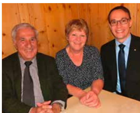
IM AMT BESTÄTIGT: der neue „alte“ Vorstand freut sich auf seine Aufgaben