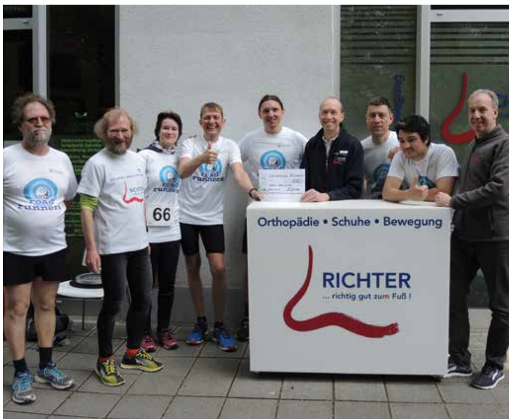
DANKESCHÖN: die noris road runners freuen sich über die Spende von Orthopädie Richter.