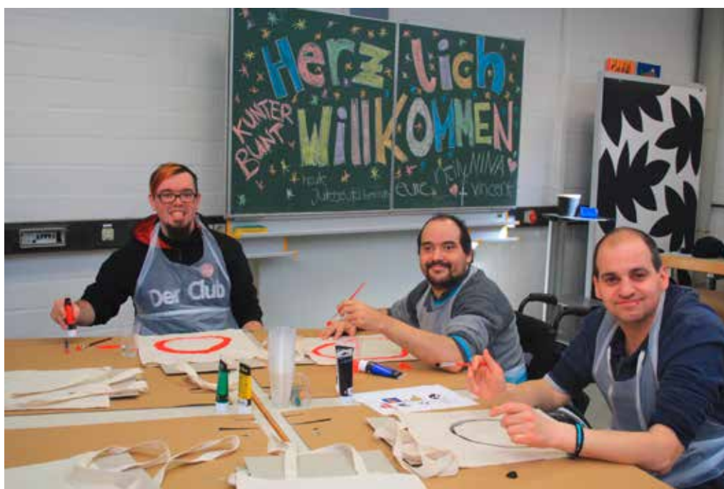
KREATIV: Hier gestalten die Teilnehmer Jutebeutel.

Das Stichwort an diesem Tag war „Glück“ oder viel mehr „Was braucht ihr um glücklich zu sein?“. Während sich alle drüber unterhielten, was für sie Glück ist, gingen wir herum und halfen, wo Unterstützung notwendig war. Entstanden sind viele, bunte und kreative Plakate. Im Endeffekt kann man sagen, dass dieses Zusammentreffen für uns, sowie für die Schüler eine schöne und zugleich sinnvolle Begegnung war. In den anderen