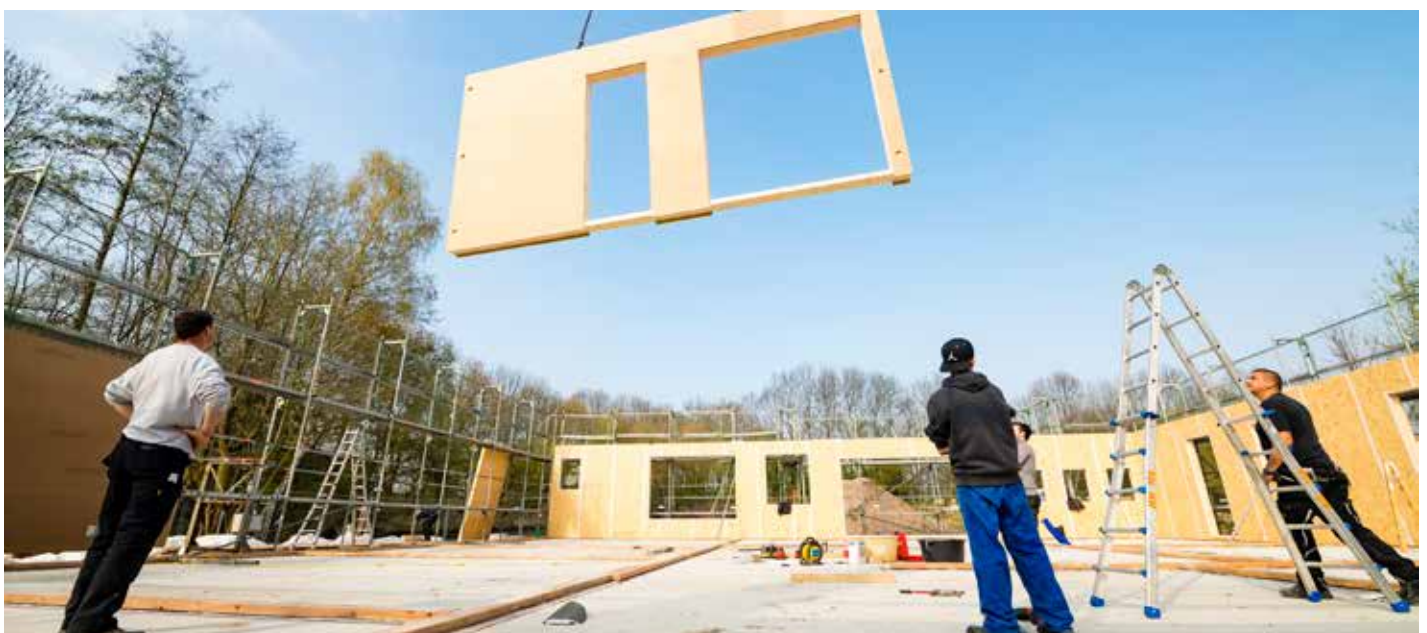
BAUSTELLENTETRIS: Jedes Puzzleteil, wie diese Wand, muss an die richtige Stelle.

los. Mit Baggern wurden Schächte ausgehoben, eine ebene Fläche geschaffen und schnell das Fundament für die kommende Kükenkoje gegossen. Mittlerweile stehen bereits die meisten Wände und lassen erahnen, wo demnächst jede Menge Kindergeschrei ertönt. Auch beim Personal tut sich einiges. Erste Vorstellungsgespräche haben bereits stattgefunden. Für den Sommer ist eine gemeinsame Besichtigung mit den Eltern geplant, damit sie einen Eindruck bekommen, wo ihre Sprösslinge demnächst große und kleine Abenteuer erleben. Es bleibt spannend, was bis zum Startschuss am 1. September noch alles passiert. Mittendrin berichtet in der Weihnachtsausgabe von der offiziellen Eröffnung.