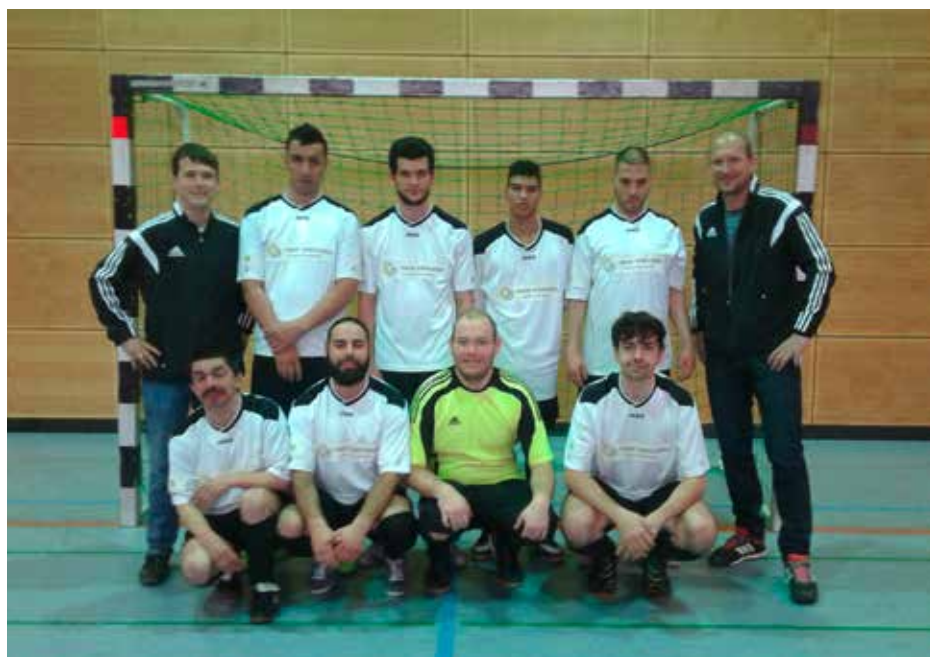
HART UMKÄMPFT: Im Elfmeterschießen sicherten sich die noris kickers den Titel des Bayerischen Hallenfußball-Meisters.

Der Höhepunkt der Hallenrunde war das Finalturnier Mitte März in Erlangen. Nach zwei Siegen in der Vorrunde wartete im Halbfinale die erste Herausforderung mit der Mannschaft aus Wernberg – Köblitz. In diesem Spiel lag man bereits nach drei Minuten mit 0:1 zurück. Brach man noch vor einem halben Jahr bei einem Rückstand in sich zusammen, ist es jetzt möglich den Rückschlag zu verdauen und gemeinsam