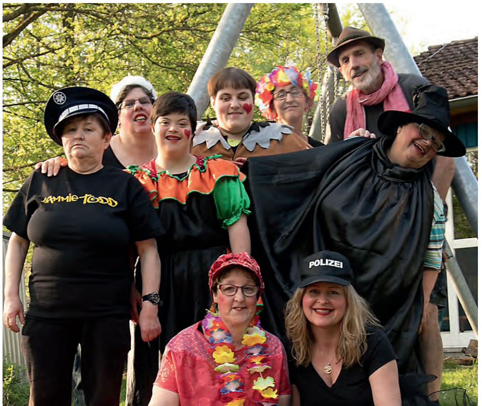
MIT VERKLEIDUNG: Auch das Theater spielen wird im BUNI angeboten.