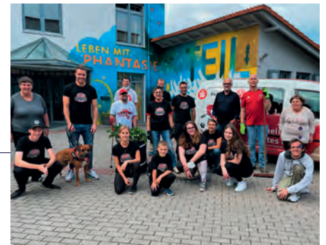
GELUNGENE AKTION: Gemeinsam wurde der Garten des Wohnheims auf Vordermann gebracht.

dass Hilfe gebraucht wird: Unkraut jäten, Bäume zurückschneiden und vieles mehr. Mit Scheren, Rechen und Schaufeln bewaffnet erschienen im August ca. 25 Fans vom FCN und Mitarbeiter und Mitarbeiterinnen der Sparkasse Nürnberg. Auch viele der Bewohner und Bewohnerinnen halfen mit und der Garten war danach nicht wiederzuerkennen. FCN-Torwart Christian Mathenia zeigte, dass er nicht nur ein guter Torwart ist,