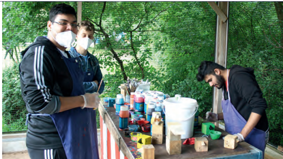
KREATIV: Im Kunstkäfig experimentierten die Teilnehmer mit Farbe.

Ziel des Aktionstages war die Vorstellung der verschiedenen Arbeitsbereiche des Gartenbaus und des Werk Süd sowie das Kennenlernen der Gruppenleiter im Berufsbildungsbereich.