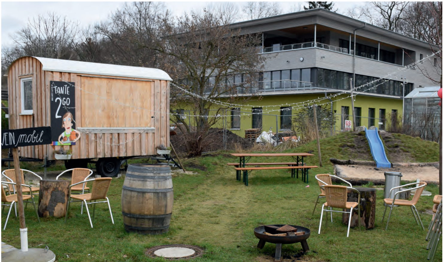
HARMONISCH: Das neue Verwaltungsgebäude fügt sich gelungen in das Gelände der Natur-Erlebnis-Gärtnerei ein.