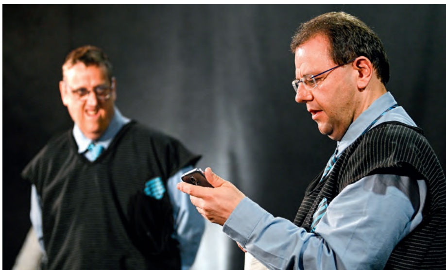
RIESIGER ERFOLG: Alle vier Juni-Vorstellungen des THEATER DREAMTEAM waren komplett ausverkauft