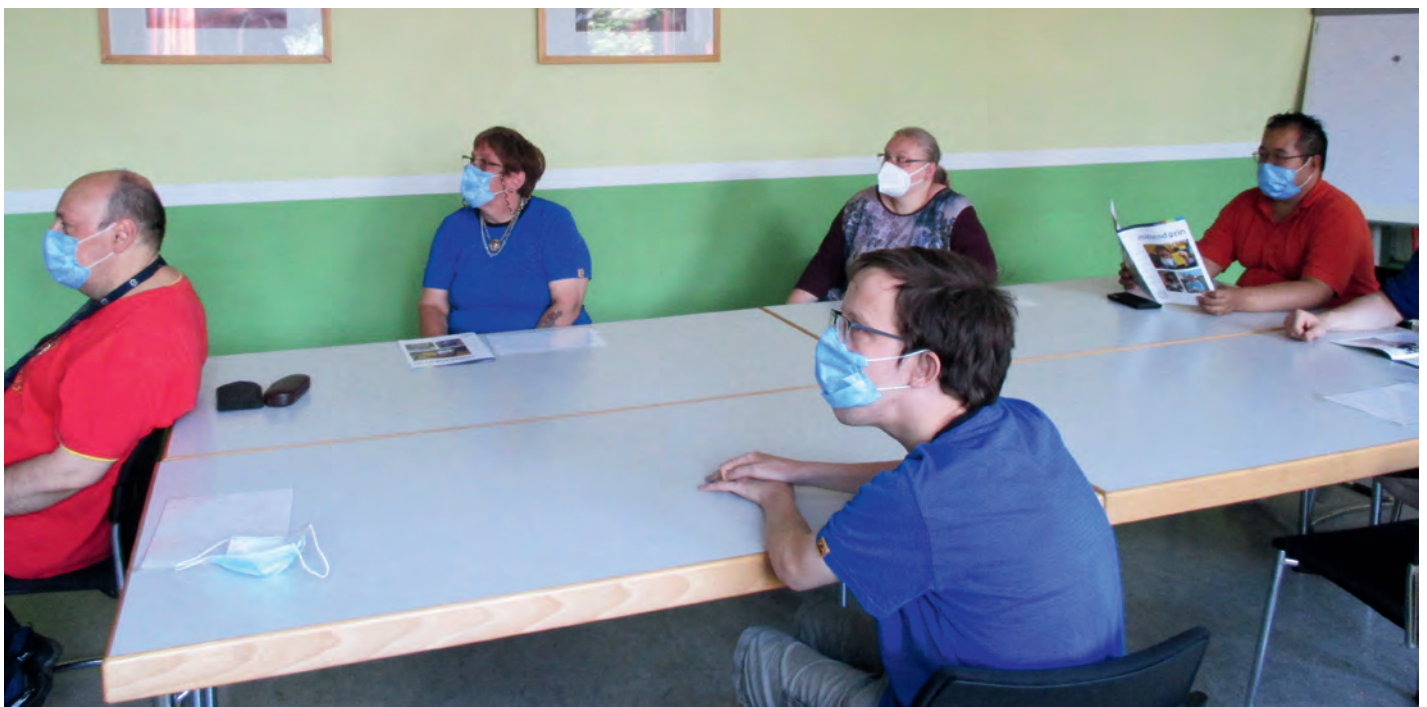
UNGEWOHNT: Informationsaustausch fand dieses Mal per Blick auf den Beamer statt.