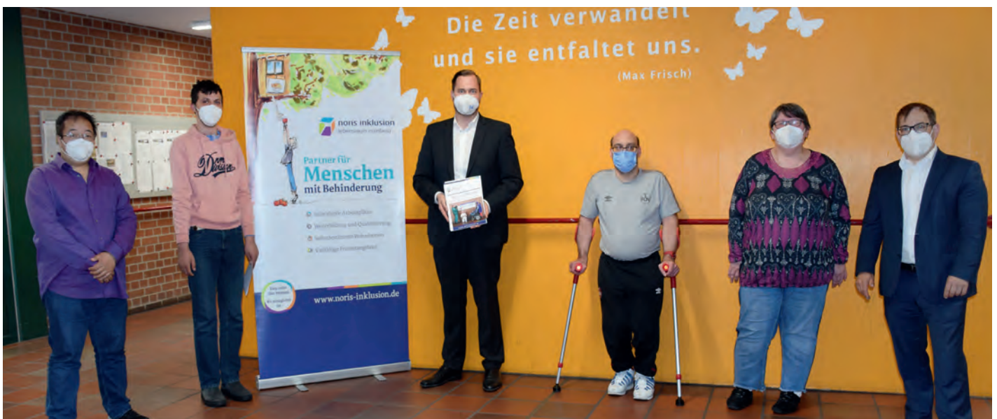
WICHTIG: Konstruktiver Austausch zwischen Werkstatt und Politik im Werk Süd von noris inklusion.