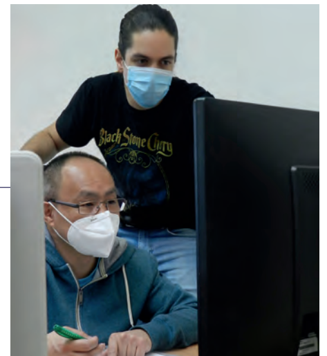
SORGFÄLTIG: Am Computer kontrollieren die Beschäftigten die gescannten Dokumente.