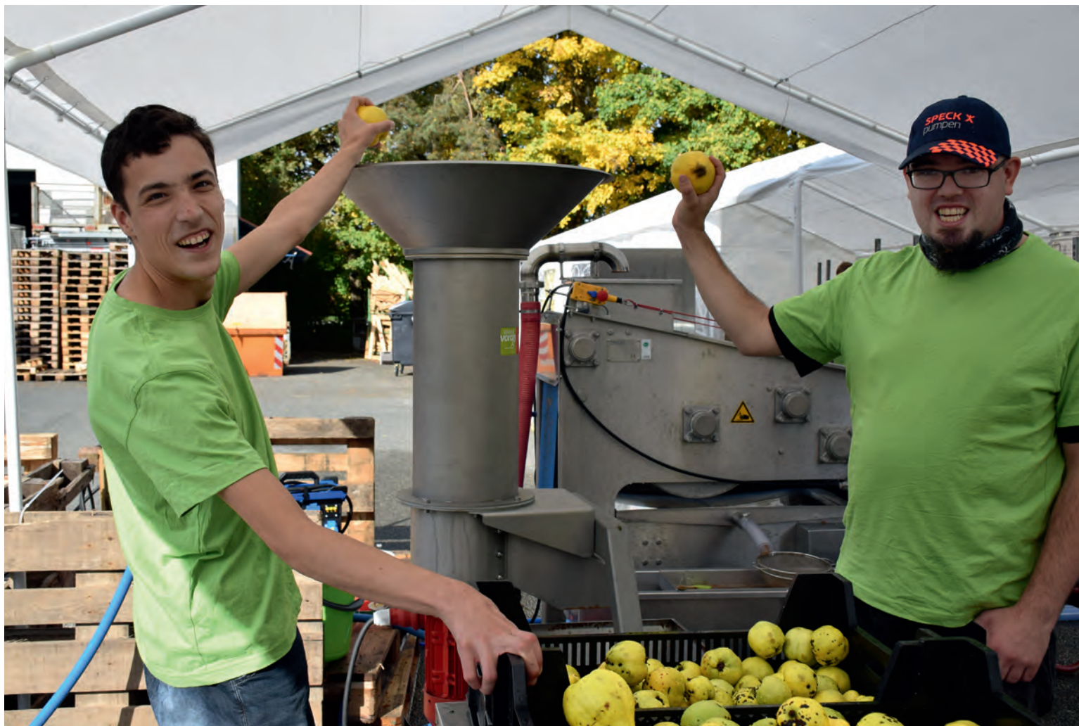
SEHR BELIEBT: Vor allem Äpfel und Quitten wurden in großen Mengen angeliefert.