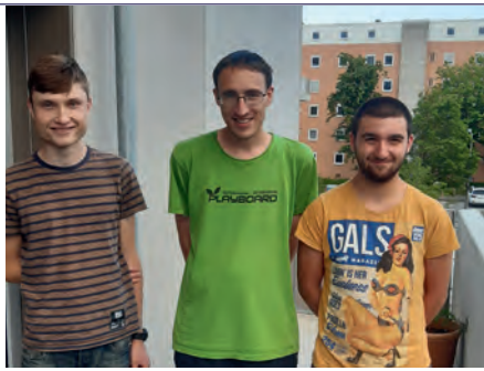
SICHTLICH STOLZ: Die „jungen Wilden“ auf dem Balkon in der Neusalzerstraße.

„Wow, schau dir den Boden an!“, „Ist jedes Zimmer so groß?“ „Einen Balkon