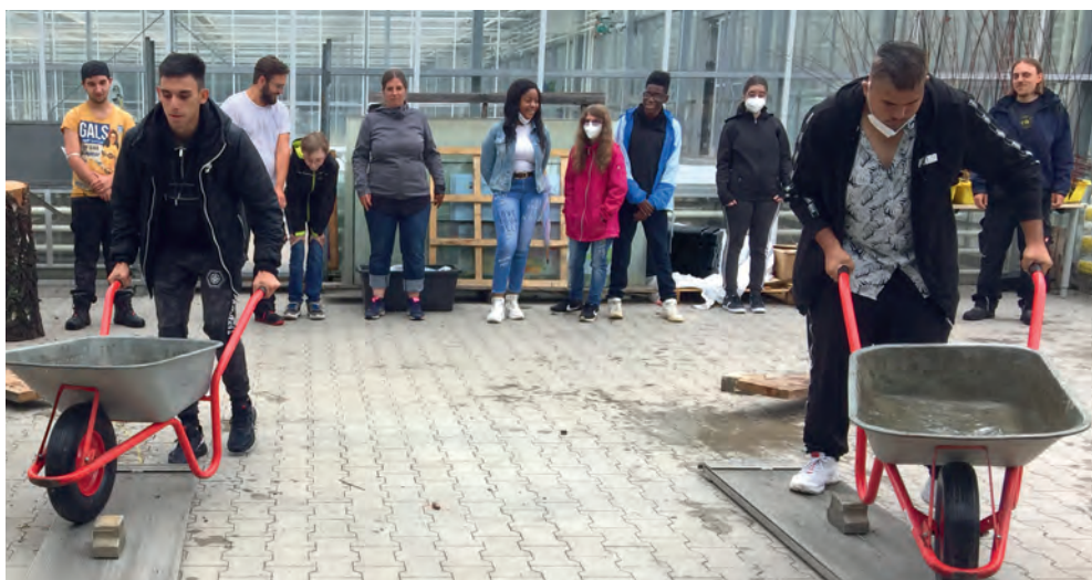
GESCHICKLICHKEIT: Beim Schubkarrenrennen konnten eigene Kompetenzen getestet werden.