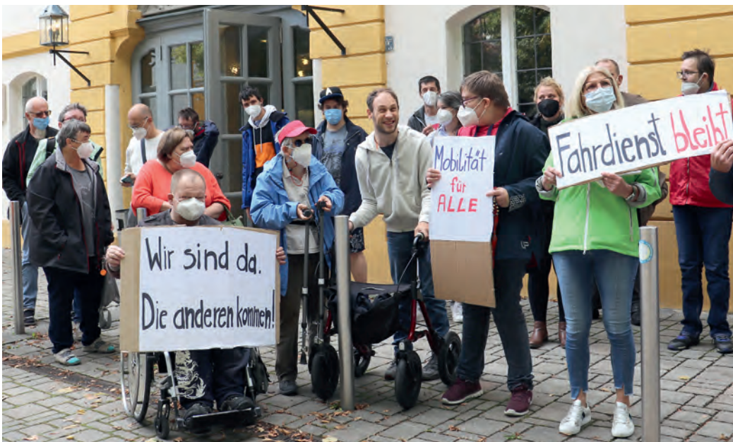
PROTEST IN ANSBACH: Betroffene fürchten deutliche Einschränkungen ihrer Mobilität.