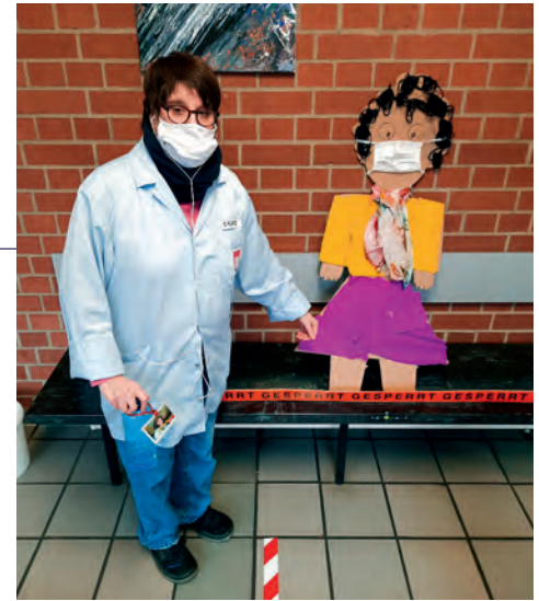
WICHTIG: Mit den Figuren werden die wichtigen Abstandsregeln veranschaulicht.