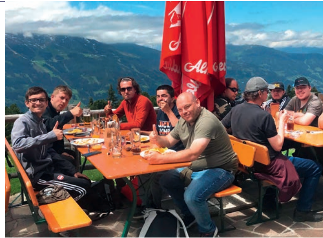
ALPENBLICK: Die noris kickers lassen sich die Brotzeit in luftiger Höhe schmecken