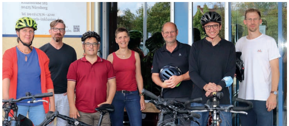
GEMEINSAM STARK: Per App wurden die Kilometer der einzelnen Fahrer aufgezeichnet und addiert.

und fachsimpelten schon, wie es im nächsten Jahr weitergehen und man in Zukunft noch mehr Angestellte und auch Beschäftigte in das Team einbinden könnte.