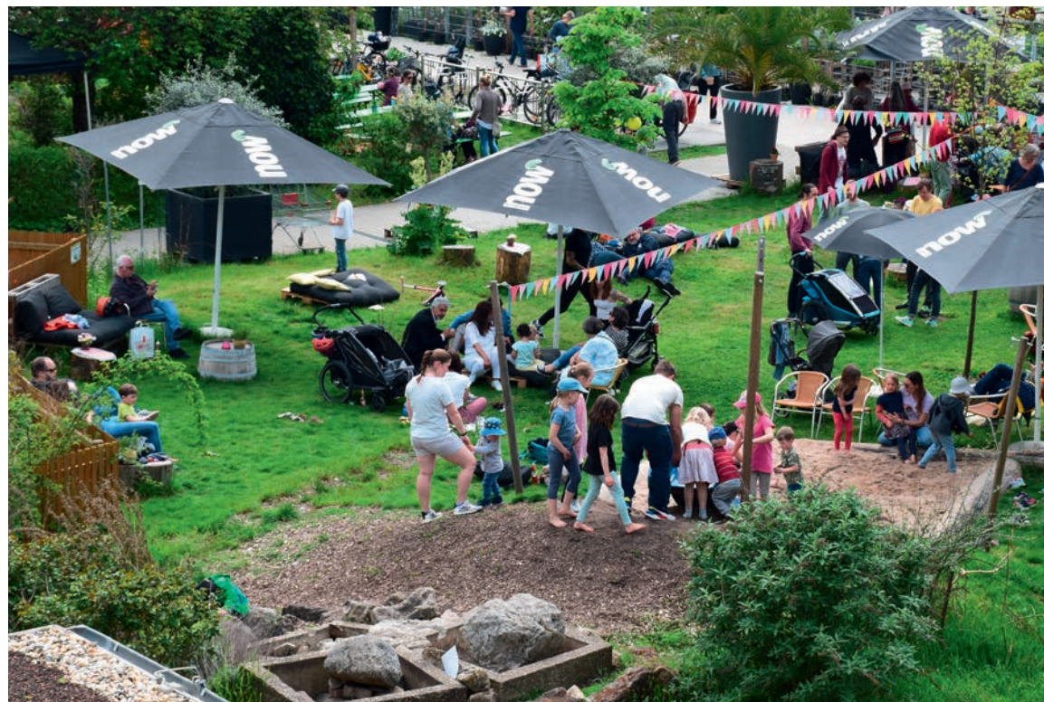
ÜBERBLICK: Vom neuen Verwaltungsgebäude hat man einen schönen Ausblick auf das Gelände.