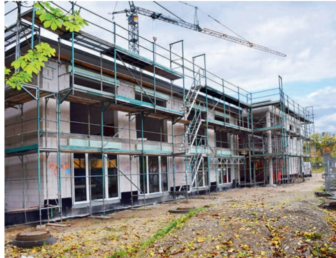
STEIN AUF STEIN: Das Wohnheim in der Braillestrasse nimmt Gestalt an.

Es gibt deshalb bereits viele Interessenten für ein Zimmer im neuen Wohnheim und sie bekommen nun eine Einladung von der noris inklusion. Auch weiteres Personal muss natürlich eingestellt werden. Bei Fragen oder Interesse an einem Zimmer, bitte an die pädagogische Leiterin Gisela Ascherl wenden: g.ascherl@noris-inklusion.de