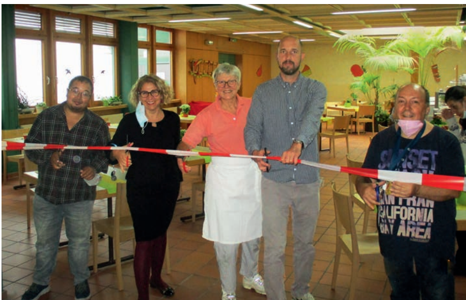
SCHNIPP-SCHNAPP: Der Speisesaal wird feierlich eröffnet