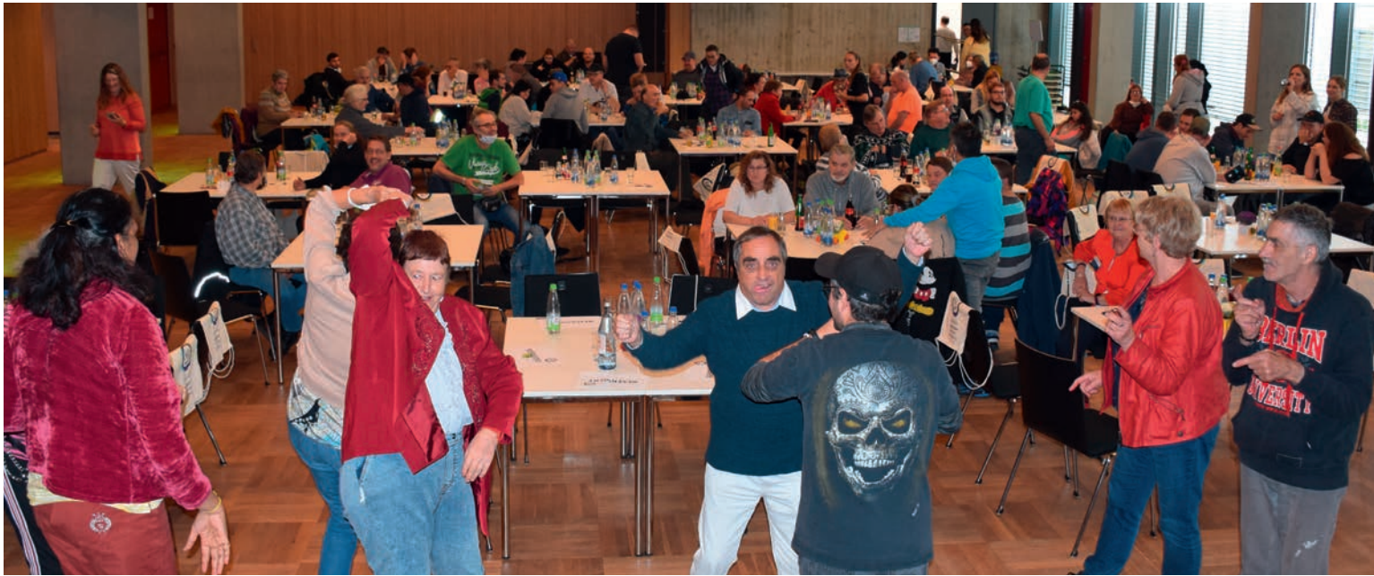
TANZBEIN: Bei Hits aus den letzten 40 Jahren blieb niemand lange sitzen!