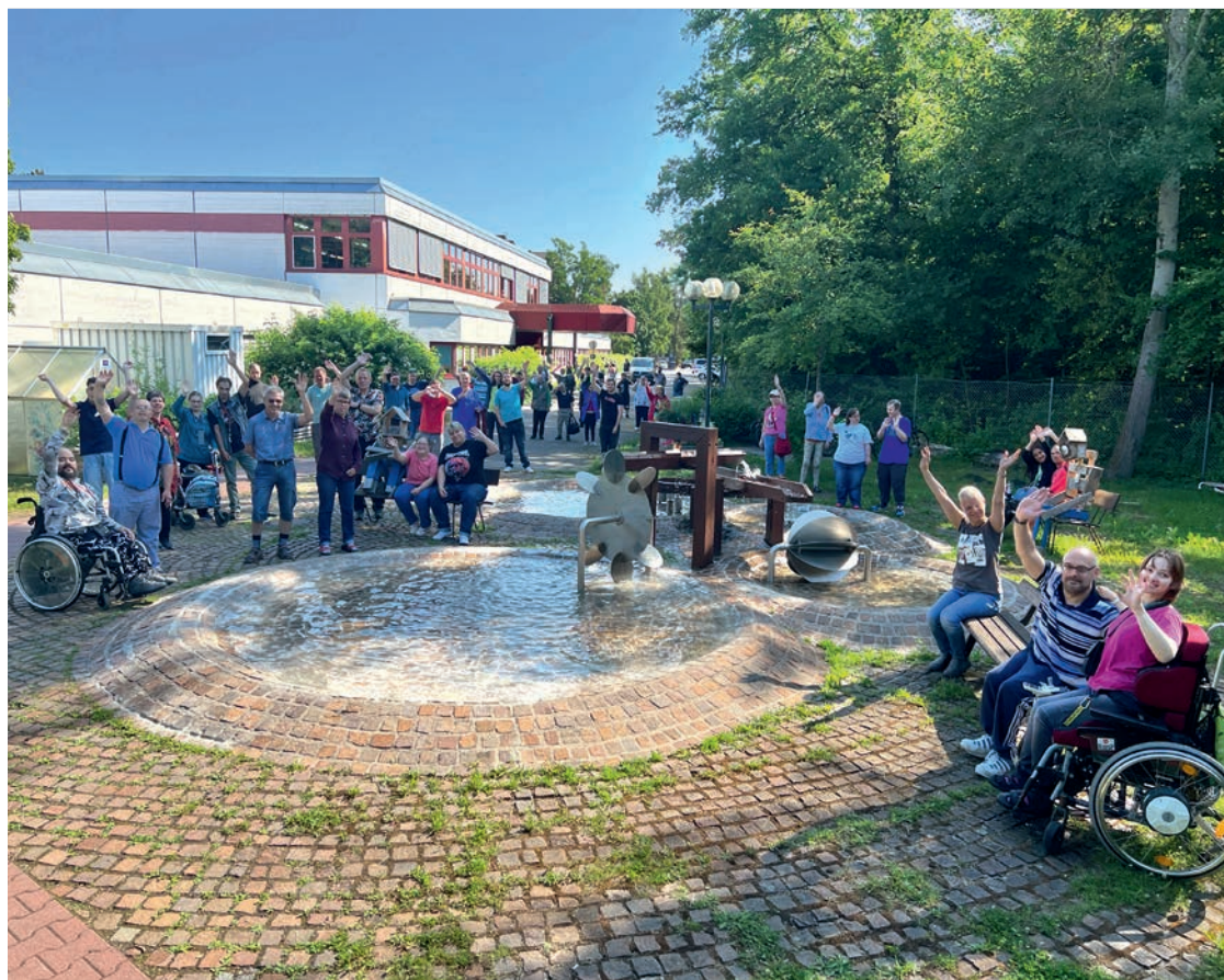
2022: Das Werk Süd hat sich stetig weiterentwickelt