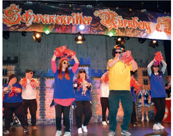
DER SAAL BEBT: Die Noris-People aus dem wilden Norden