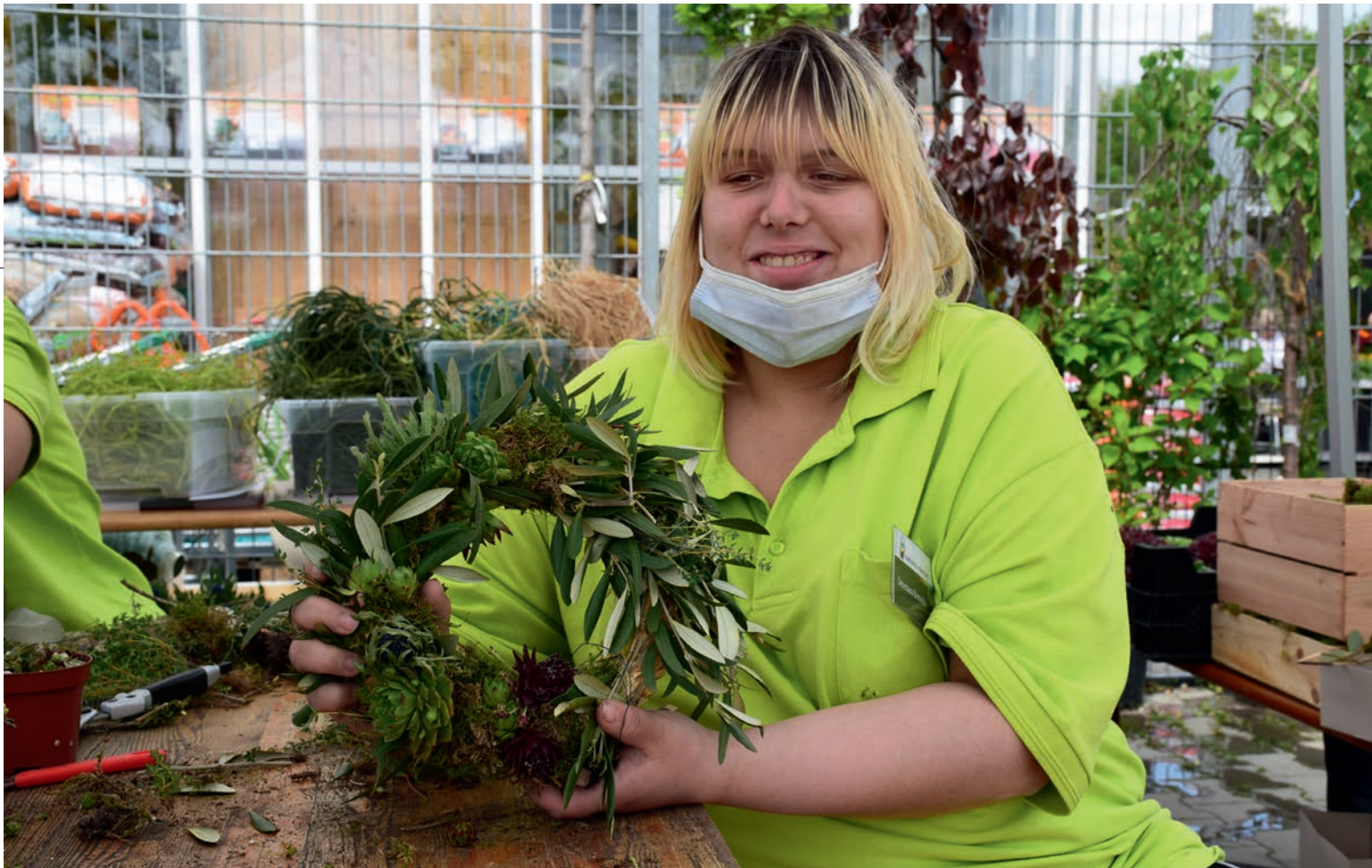
SELBERMACHEN: Jeder hatte die Möglichkeit sich einen eigenen dekorativen Kranz zu binden.