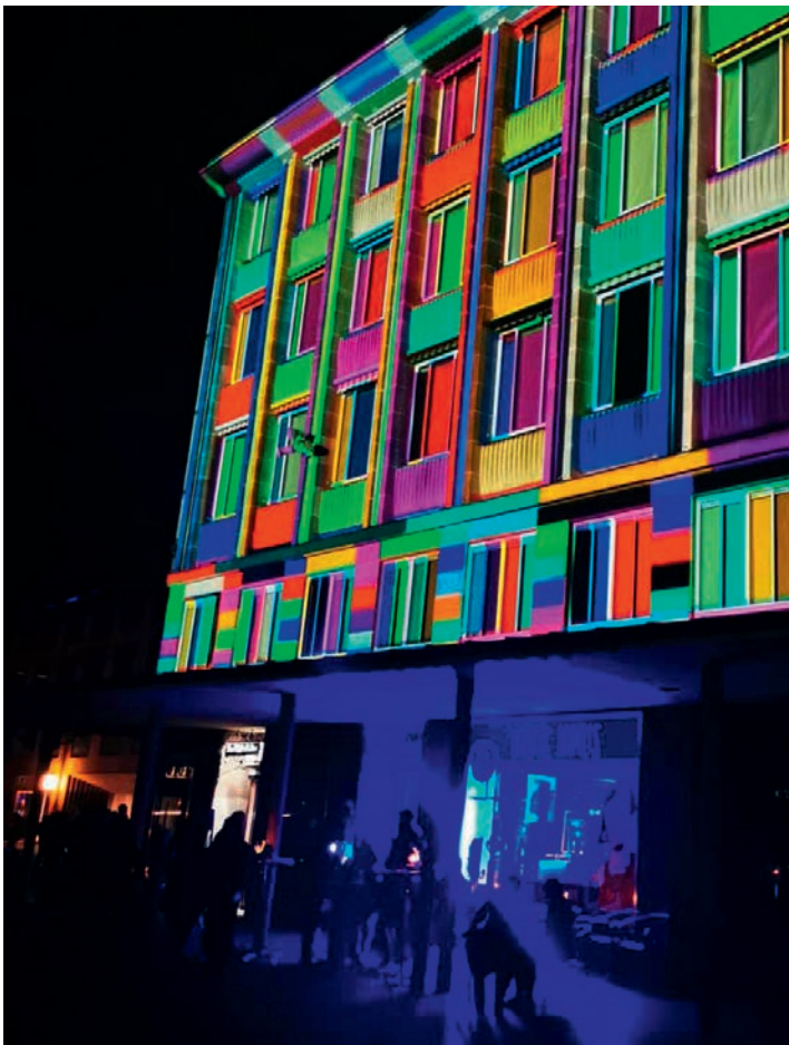
STYLISCH: Während der Blauen Nacht war TANTE NORIS am Markt in neonblaues Licht getaucht.