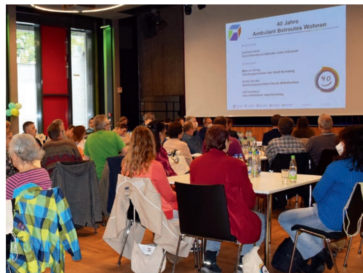
FESTLICH: Viele ABW-Bewohner kamen zur Feier