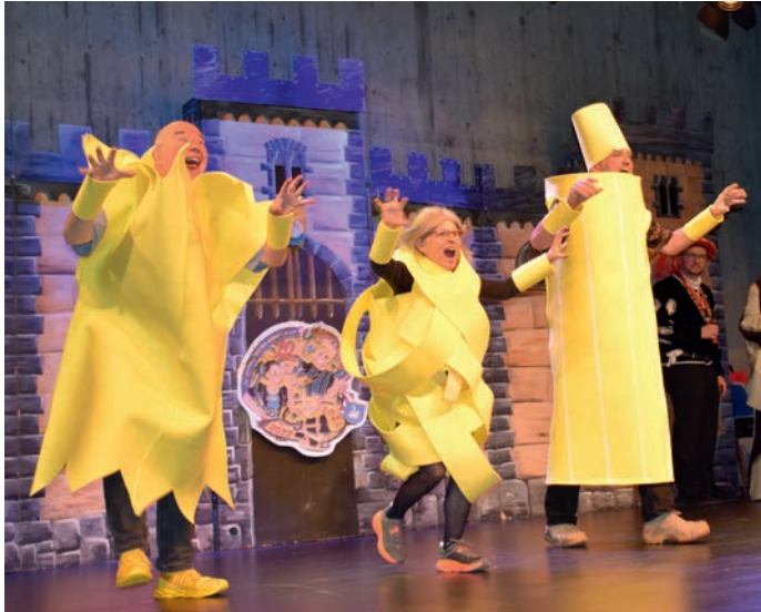
DREAMTEAM GANZ IN GELB: Tanzwütige Viren