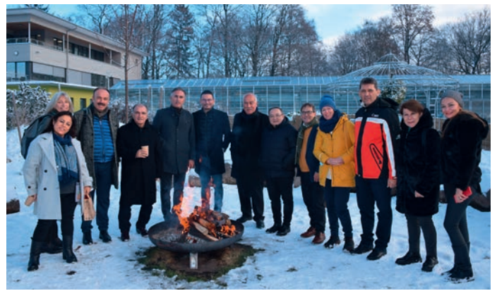
STÄDTEPARTNER: Die Delegation aus Antalya informiert sich über Inklusion in Nürnberg