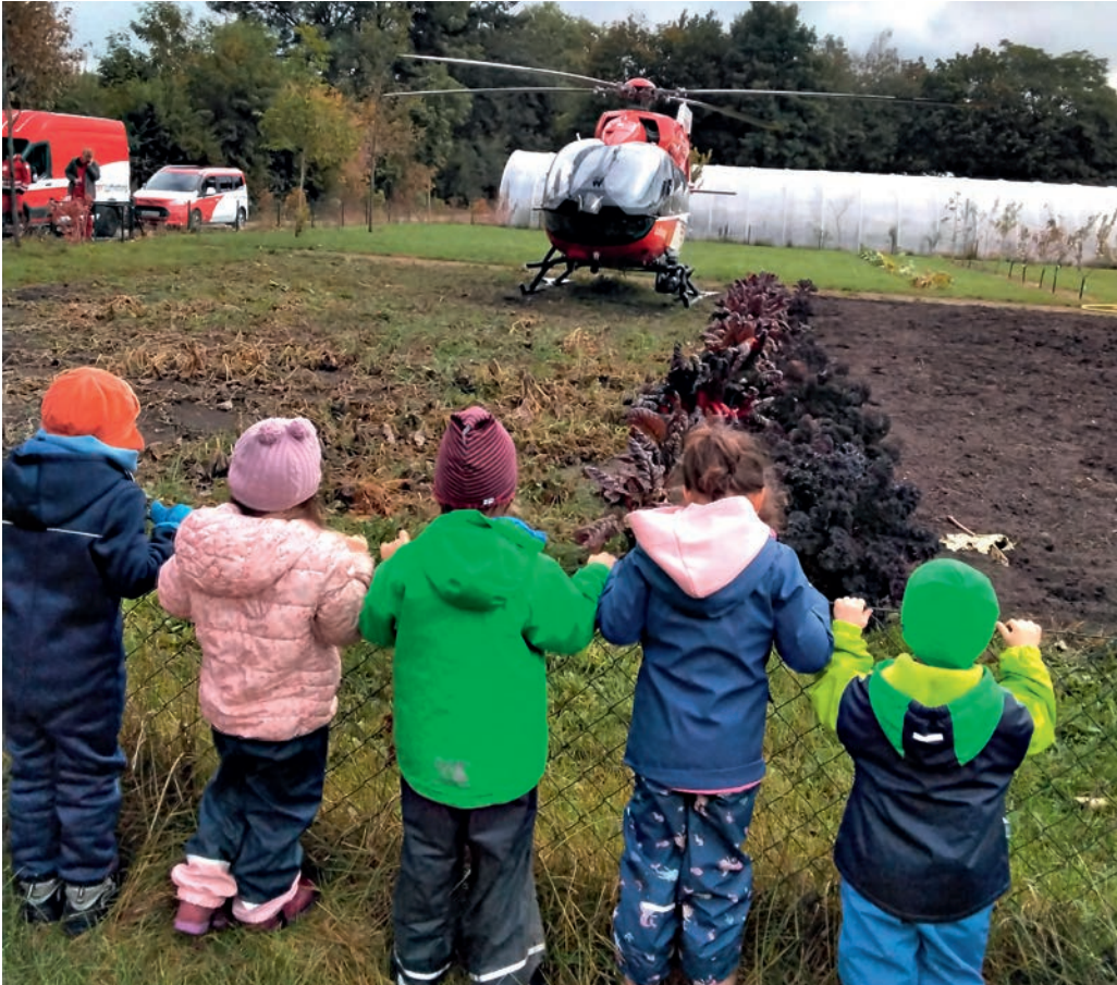
ZAUNGÄSTE: Neugierig beobachten die Jüngsten den gelandeten Rettungshubschrauber.