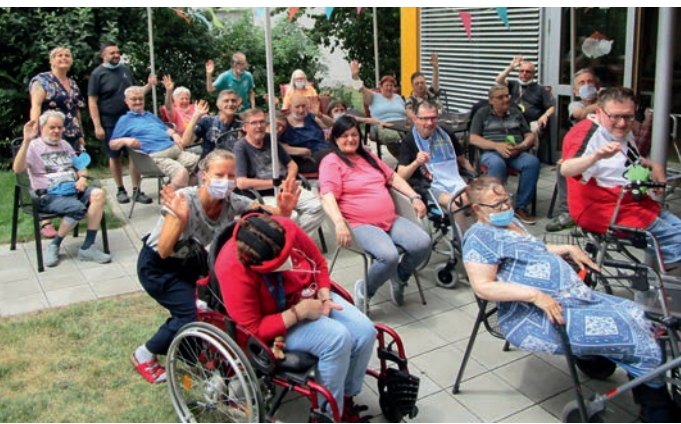
STIMMUNG: Die TENE-Senioren feiern gern

Das Jahr 2022 war trotz Pandemie ein Jahr des Erlebens, der Freude, des Spaßes und des Miteinanders. In der TENE 2 wurde viel für die Senioren geboten: Eine Faschingsfeier mit Krap-