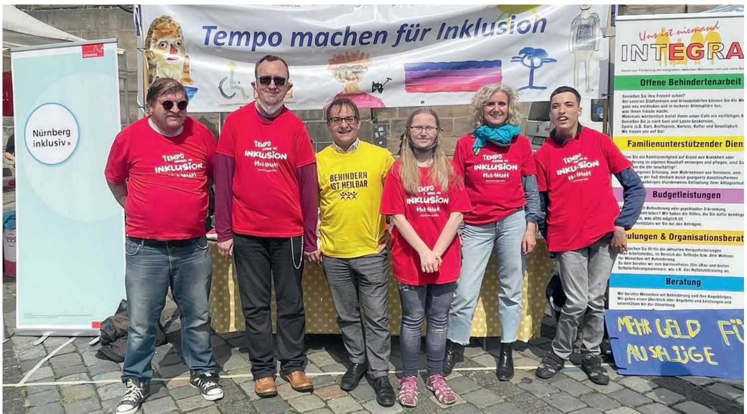
VOLLER EINSATZ: Beschäftigte und Mitarbeiter von noris inklusion am OBA-Stand.