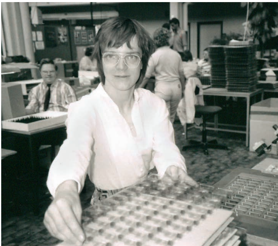
Ab 1982: Die Anfänge am Standort Langwasser

Neue Wege gehen und flexibel zu reagieren, war stets das Bestreben aller Verantwortlichen und Mitarbeiter in den letzten vier Jahrzehnten. In den 80er Jahren kamen die meisten externen Aufträge aus dem produzierenden Gewerbe als Beistellungen für die verlängerte Werkbank. Daran hat sich bis heute wenig verändert. Da viele der Großkunden wie beispielsweise Grundig oder AEG die Fertigung einstellten, musste sich das Werk Süd nach neuen Kunden umschauchen. Mit der Fertigung von Wärmemengenzähler-Displays für die Firma Hydrometer und dem Ausbau der Schaltermontage für die Firma Sontheimer ging es in den 2000er Jahren bergauf, bevor die Bankenkrise 2009 für einen kurzzeitigen Dämpfer sorgte. Die schnell ansteigende Konjunktur gleicht das Defizit schnell wieder aus. Die Vergabe von Lohnfertigungsaufträgen durch Firmen war allerdings spürbar geschrumpft. Deshalb wurde der Fokus verstärkt auf das Thema Außenarbeit gelegt. So war die eingerichtete Außenarbeitsgruppe beim Stifthersteller Staedler ein voller Erfolg und auch die Konfektionierungsarbeiten beim Bekleidungshändler Wöhrle wurden rege in Anspruch genommen. Ein weiteres sehr gutes Beispiel war auch die im Jahr 2016 neu geschaffene Gruppe der E-Checker – Die Checker für die Ste-