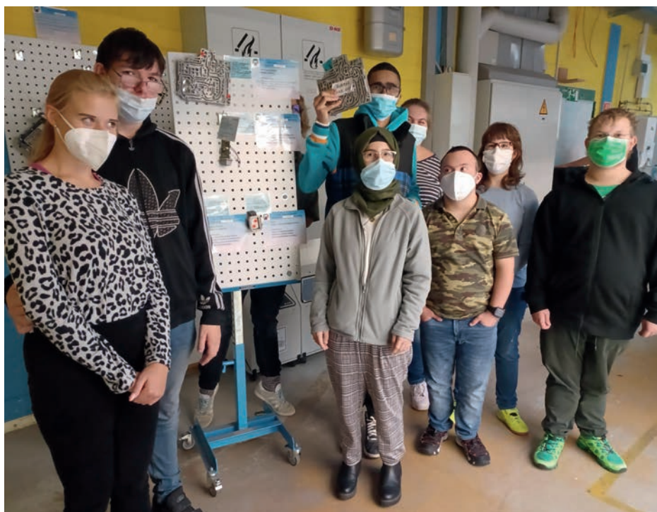
NEUSTART: Der neue Jahrgang ist angekommen.