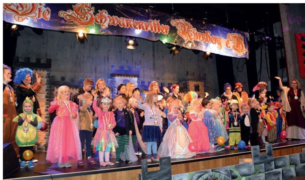
DIE KITA-KIDS: Der Faschingsnachwuchs ist gesichert!

haus - beziehungsweise die Ritterburg - bebte. Alle, ob im Publikum oder auf der Bühne, hatten an diesen Nachmittag narrisch viel Spaß! Ganz herzlichen Dank an die Fastnachtsgesellschaft „Die Schwanenritter“, dass sie diese Veranstaltung organisiert und sogar schon für das kommende Jahr eine neue Einladung ausgesprochen hat. Es war wirklich ein tolles Erlebnis und die noris inklusion ist selbstverständlich 2024 wieder gern dabei.